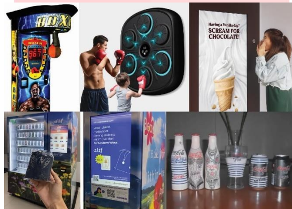
Gambar 2. Moodboard exhibition

Strategi media yang didasari teori AISAS dimulai dengan tahapan Attention hingga Share. Pada tahap Attention, brand HiLo Active akan menggunakan OOH di Critical 11, kampus-kampus, pusat perbelanjaan, dan di beberapa titik pusat Kota Bandung yang sering dilalui oleh target audience dan berguna untuk menarik perhatian. Tak hanya itu, media sosial pun digunakan untuk memaksimalkan penyebaran visual promosi brand HiLo Active sendiri dengan menggunakan Instagram. Setelah itu brand HiLo Active menggunakan OOH juga di Critical 11 yaitu banner dan poster yang sangat sering dikunjungi dan sering dikenal akan creative space, karena tempat tersebut sering digunakan untuk acara-acara besar dan mendapatkan insight yang banyak. Poster pun digunakan di kampus-kampus,