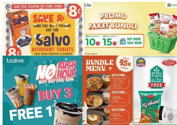
Gambar 1. Moodboard strategi kreatif