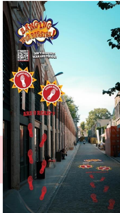
Gambar 4.8 Ambient media floor