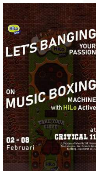
Gambar 4.9 Instagram Ads

Kegiatan promosi akan difokuskan untuk menarik minat target audiens serta memberikan informasi tentang acara yang akan diadakan oleh HiLo Active di Critical 11. Seperti pada tahap attention, promosi ini juga akan menggunakan