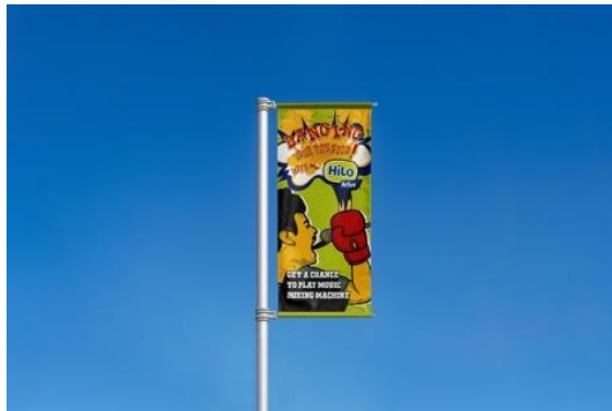
Gambar 4.7 Flag Banner

Akan dilakukan promosi dengan memasang flag banner dan ambient media floor di lokasi-lokasi strategis di Kota Bandung yang sering dilewati oleh banyak orang termasuk Generasi Z. Poster juga akan disebar ke berbagai kampus dan toko kopi untuk menarik perhatian mahasiswa yang termasuk dalam Generasi Z. Dalam iklan luar ruang (OOH) ini, akan memberitahu bahwa akan diadakan promosi yang berupa acara permainan di Critical 11, dengan tujuan agar audiens tertarik untuk hadir. Selain itu, attention juga akan diperoleh melalui media sosial menggunakan Instagram Ads, dengan tujuan meningkatkan brand recall, meningkatkan kesadaran, menarik perhatian target audiens, serta memberitahu bahwa akan diadakan promosi yang berupa acara permainan di Critical 11.