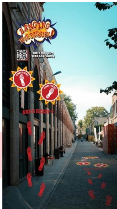
Gambar 5. Ambient media floor