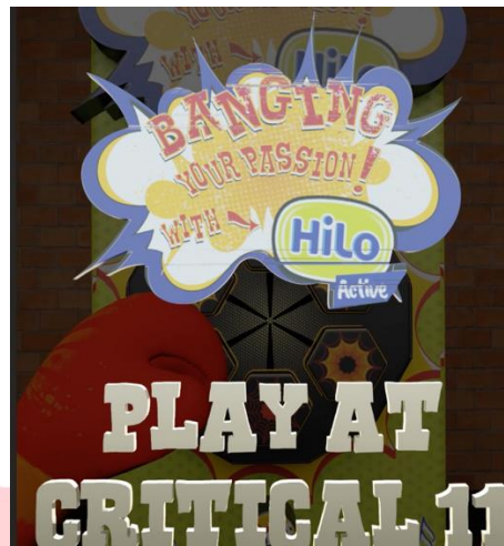
Gambar 4.14 Instagram reels 3D