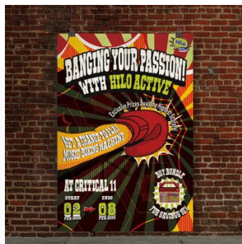
Gambar 4.11 Poster