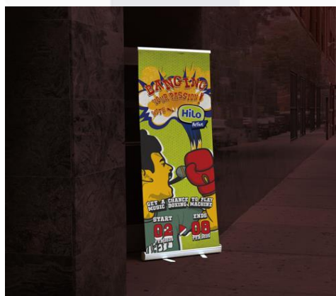
Gambar 4.12 X Banner