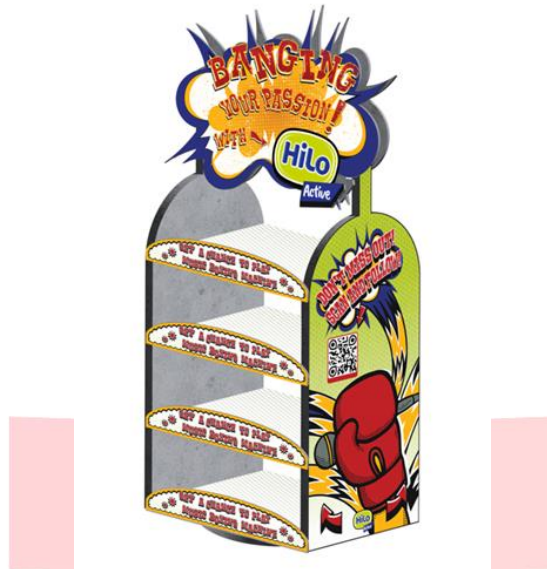
Gambar 3. Sketsa Standing Display