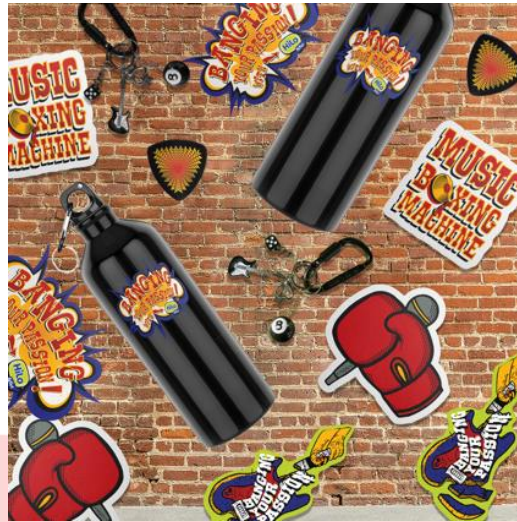
Gambar 4.15 Merchandise