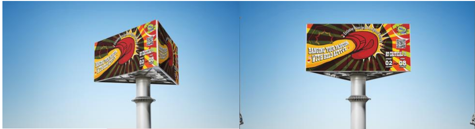
Gambar 4.10 Billboard

media iklan luar ruang (OOH) dan media sosial, media iklan luar ruang termasuk billboard, poster, dan x-banner. Billboard akan dipasang di lokasi-lokasi strategis di Kota Bandung yang sering dilewati oleh banyak orang termasuk Generasi Z, untuk poster akan disebar di kampus-kampus dan toko kopi, serta pemasangan x-banner hanya akan dipasang ditempat acara itu sendiri yaitu di Critical 11.