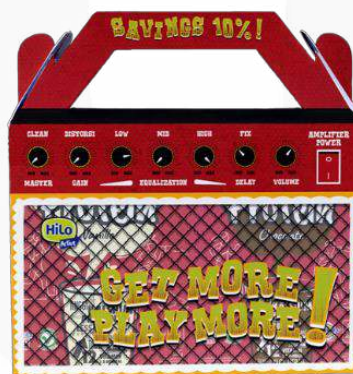
Gambar 6. Bundling packaging