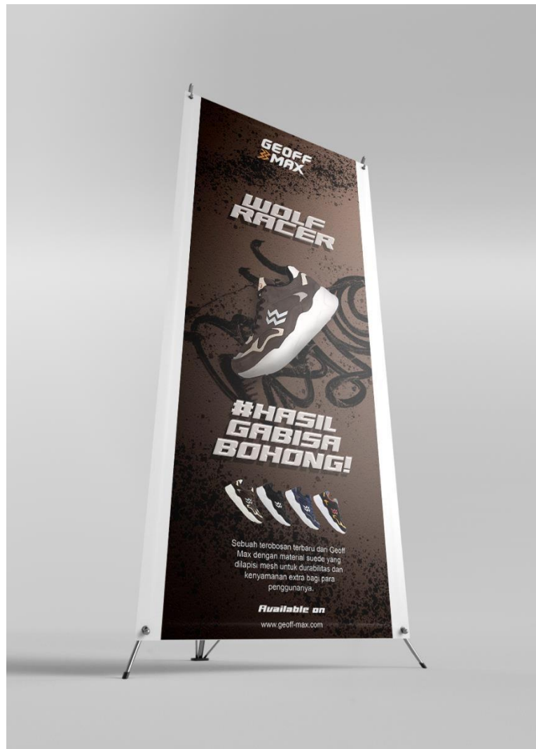
Gambar 3. X Banner Geoff Max

Pada bagian interest , X Banner dan Merchandise digunakan sebagai media Untuk menarik konsumen.