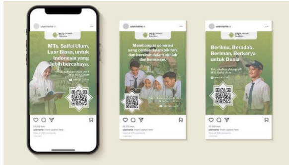
Gambar 3 Instagram Feeds