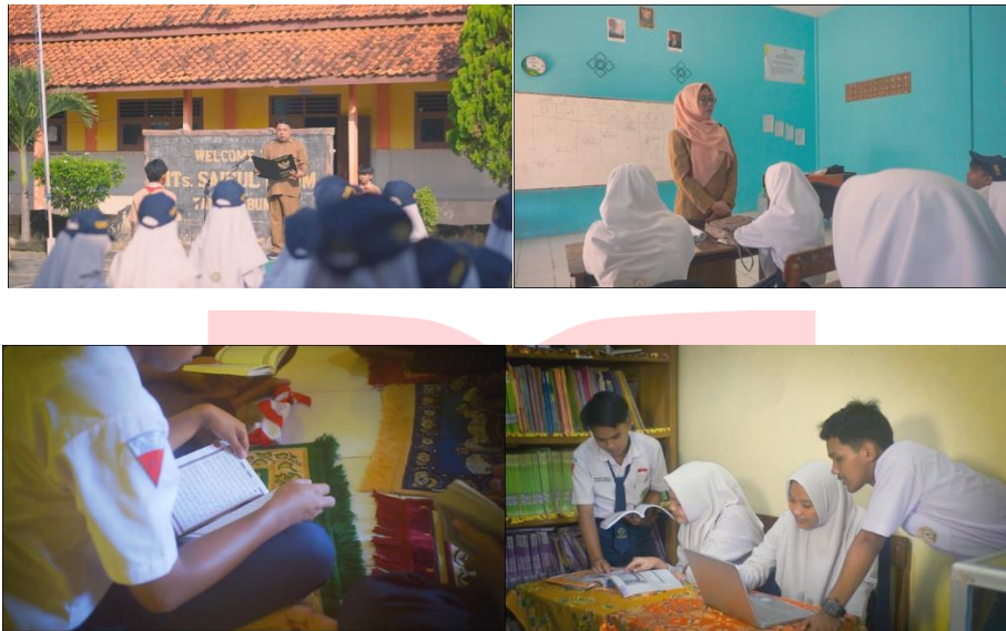
Gambar 2 Cuplikan Video Profile

Konsep visual dalam perancangan media promosi MTs. Saiful Ulum dirancang agar selaras dengan identitas sekolah dan sesuai dengan segmentasi target pasar yang dituju. Gaya visual yang diterapkan mengusung nuansa profesional, kreatif, edukatif, serta formal.