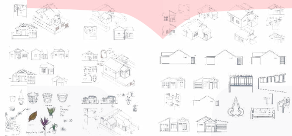
Gambar 2. Sketsa

Tahapan awal dari perancangan karya adalah sketsa yang didasari dari data-data yang ada seperti observasi, studi dokumen, hingga studi pustaka. Setelah membuat sketsa bisa dilanjutkan membuat line art .