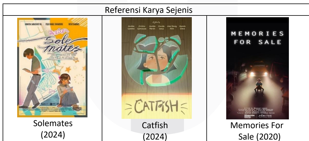
Gambar 1. Poster Karya Sejenis

Ketiga karya sejenis dianalisis berdasarkan aspek warna, komposisi, pencahayaan. Pada aspek warna Kesamaan yang dimiliki oleh ketiga animasi diatas adalah penggunaan warna kebiruan atau cool tone untuk merepresentasikan perasaan negatif seperti kesedihan, depresi, hingga sikap dingin terhadap seseorang. Sedangkan, warna hangat atau warm tone