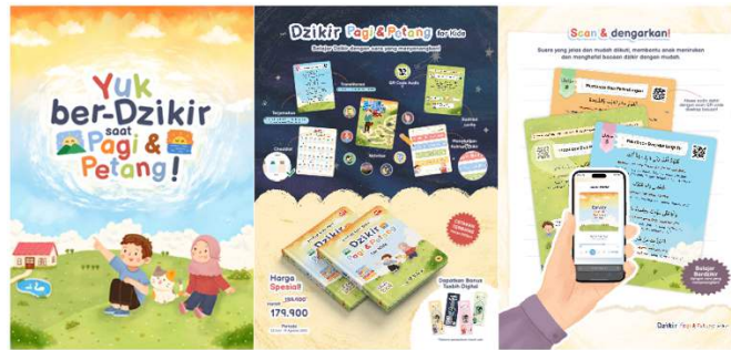
Gambar 5 Poster media promosi

Poster berukuran A3 untuk menampilkan fitur fitur yang ada dalam buku serta sebagai media promosi.