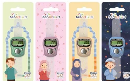
Gambar 10 Tasbih digital

digunakan sebagai alat bantu untuk menghitung dzikir yang berjumlah banyak seperti kalimat tasbih dan tahmid yang berjumlah 100x namun hanya bersifat opsional.