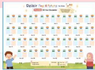
Gambar 12 Checklist board akrilik

Media interaktif pembaca yang berisi checklist box 30 hari berdzikir.