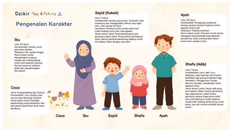
Gambar 3 Desain Karakter