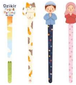
Gambar 11 Tuding (penunjuk membaca)