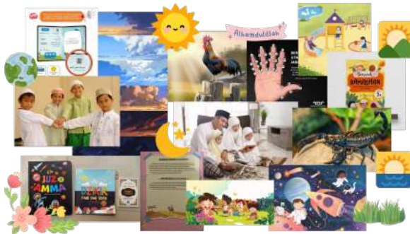
Gambar 2 Moodboard Visual