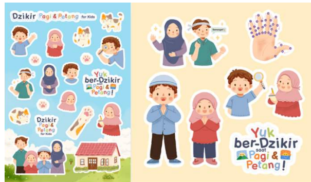
Gambar 7 Sticker kisscut dan die cut