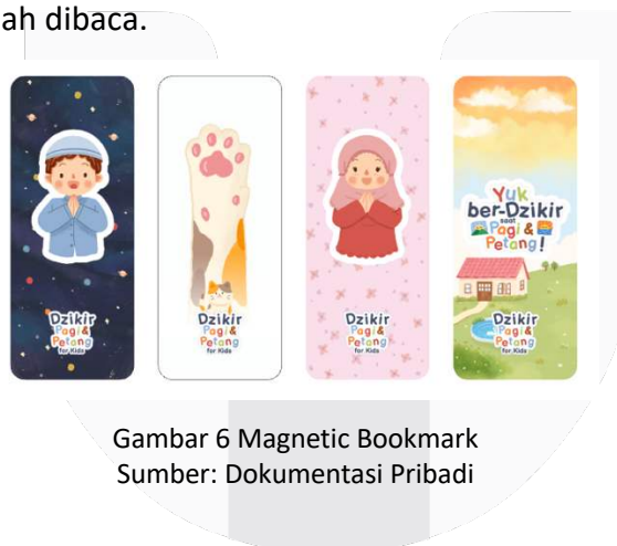
Gambar 6 Magnetic Bookmark

pembatas buku menjadi merchandise yang dapat digunakan sebagai penanda halaman yang sudah dibaca.