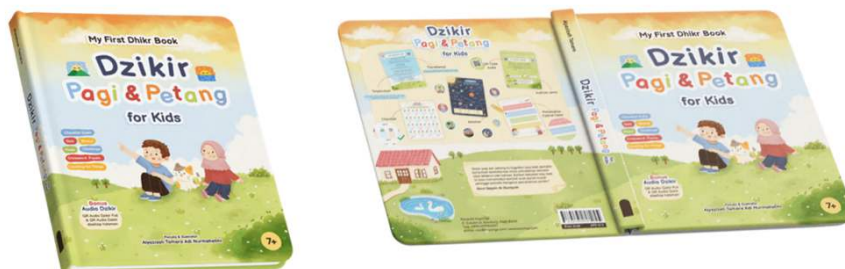
Gambar 4 Buku interaktif dzikir pagi dan petang 100 halaman