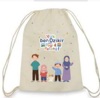
Gambar 13 String bag

Tas yang dapat diserut sebagai merchandise untuk membawa buku kecil ketika mengaji.