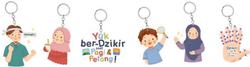
Gambar 9 Gantungan kunci akrilik

Tersedia dalam 6 variasi, yang bertujuan untuk menarik audiens. Gambar gantungan kunci berupa ilustrasi karakter, ajakan untuk berdzikir dan tutorial berdzikir dengan jari.