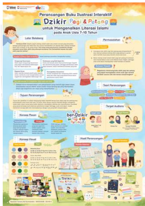
Gambar 8 Infografis rangkuman perancangan

Berisi rangkuan terkait semua laporan penelitian mulai dari latar belakang hingga hasil perancangan