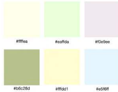
Gambar 4 Warna