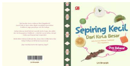
Gambar 6 Desain Cover Buku (Sumber: Lulu Nuryasfia, 2025)