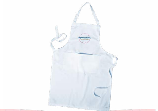
Gambar 13 Desain Apron

Apron dengan bahan katun menjadi media pendukung dan promosi dari buku ini sebagai pelengkap aktivitas di bagian yang ada dalam buku yaitu bagian resep, membuat makanan.