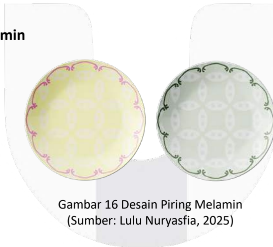
Gambar 16 Desain Piring Melamin

Piring melamin sebagai media pendukung dan pelengkap dari buku ini yang di desain dengan desain batik menggunakan bahan melamin yang tentunya child safety .