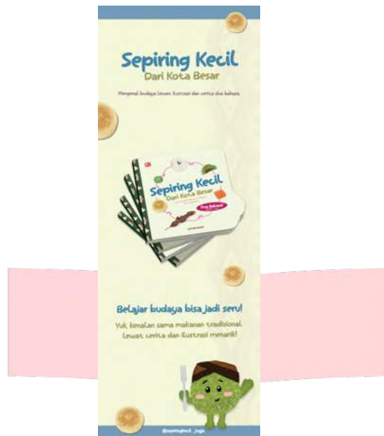
Gambar 9 Desain X-Banner