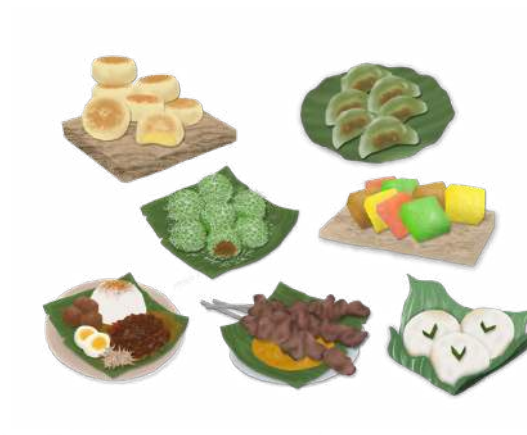
Gambar 1 Desain Karakter