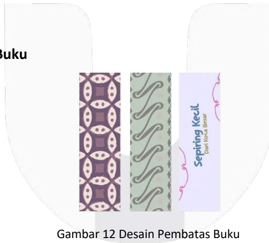
Gambar 12 Desain Pembatas Buku