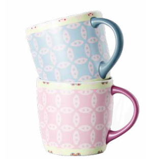
Gambar 15 Desain Mug

Mug dengan gambar batik khas Yogyakarta, di desain dengan dua warna berbeda yaitu merah muda identik dengan perempuan, biru identik dengan laki-laki, menjadi media pendukung dan promosi dari buku ini.