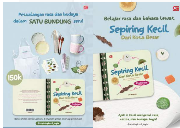
Gambar 8 Desain Poster A3 dan Poster A4