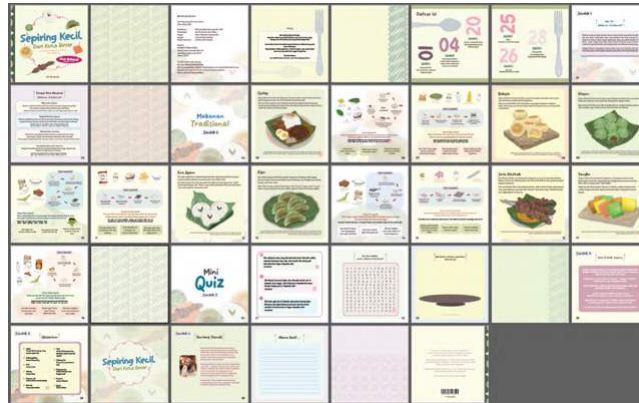
Gambar 7 Desain Isi Buku

Buku ilustrasi Sepiring Kecil Dari Kota Besar berukuran 20 cm x 20 cm dengan total 36 halaman. Memiliki 5 bagian. Bagian 1, Apa itu makanan tradisional, hal 1. Bagian 2, Asal usul makanan tradisional khas Yogyakarta, hal 4-19. Bagian 3, Mini Quiz , hal. 20-24. Bagian 4, Epilog, hal. 25. Bagian 5, Glosarium, hal. 26.