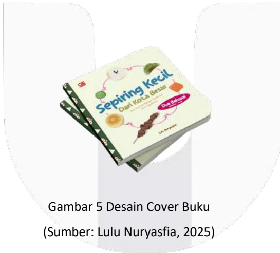
Gambar 5 Desain Cover Buku