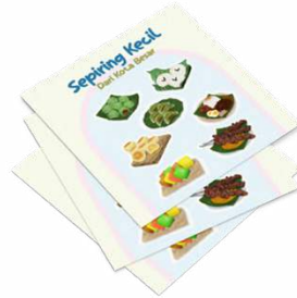
Gambar 11 Desain Sticker Vinyl