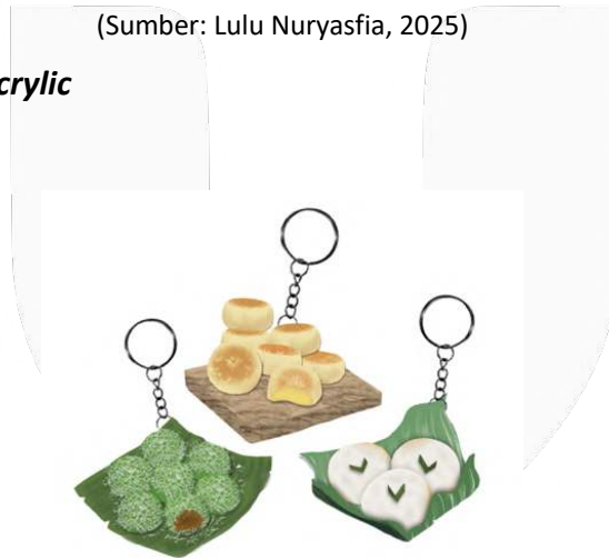
Gambar 10 Desain Keychain Acrylic