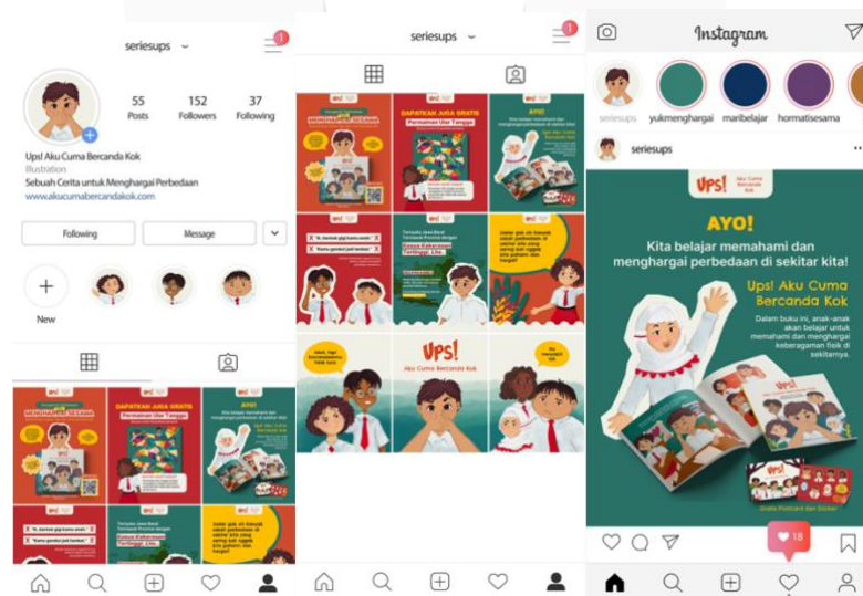
Gambar 9 Feeds Instagram