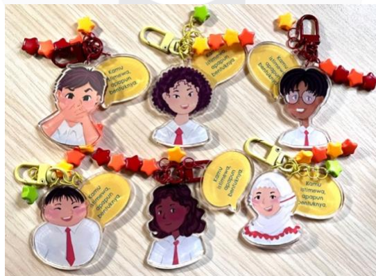
Gambar 10 Gantungan Tas