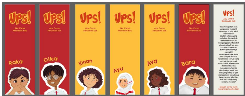
Gambar 8 Pembatas Buku