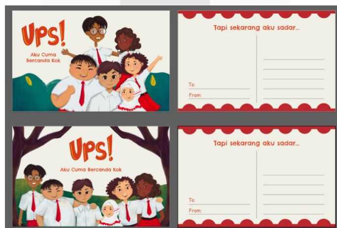
Gambar 12 Postcard