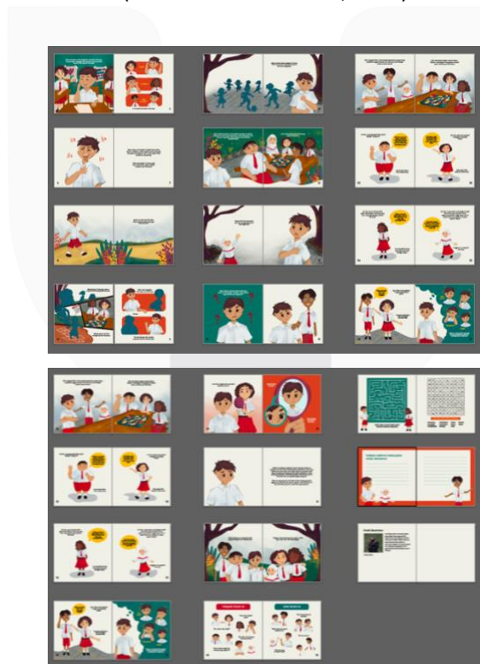
Gambar 6 Isi Buku