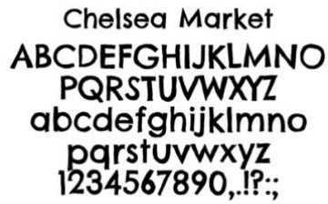
Gambar 2 Chelsea Market