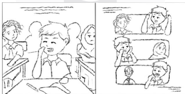
Gambar 1 Sketsa Ilustrasi

Gaya ilustrasi kartun digunakan karena mampu menyampaikan pesan secara ringan dan mudah dipahami. Elemen dan karakter akan dibuat dengan proporsi yang tidak realistis namun tetap komunikatif.