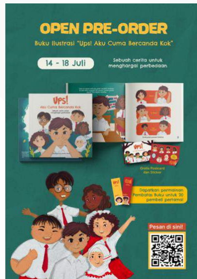
Gambar 8 Poster