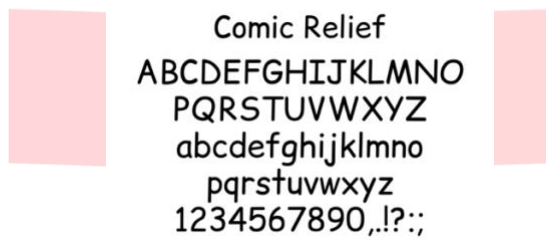
Gambar 3 Comic Relief

Jenis tipografi yang digunakan merujuk pada jenis huruf yang sering digunakan dalam buku cerita anak. Yakni sans serif berjenis chalkboard dan comic karena font yang memiliki karakteristik keterbacaan yang jelas, tidak kaku, dan terkesan santai.