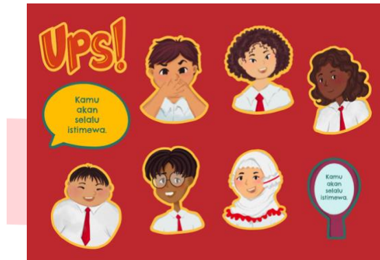
Gambar 9 Stiker