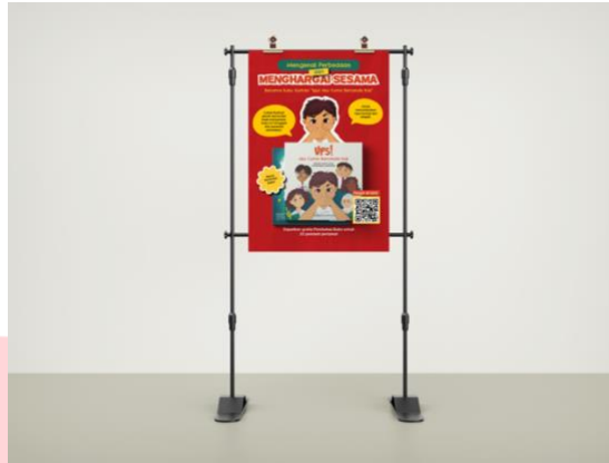
Gambar 7 Tripod Banner