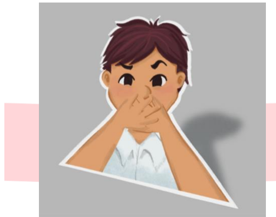
Gambar 11 Standee