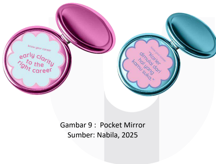
Gambar 9 : Pocket Mirror