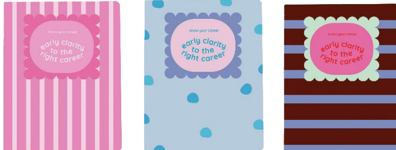
Gambar 8 : Notebook