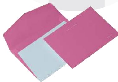
Gambar 7 : Envelope