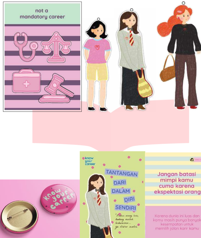
Gambar 6 : Sticker, Keyrings, Pin, Postcards, & Poster