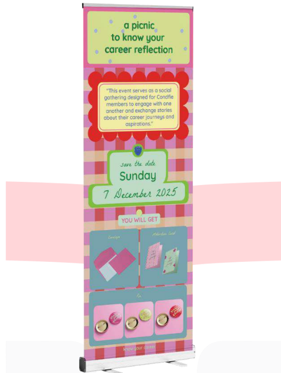
Gambar 4 : Social Gathering