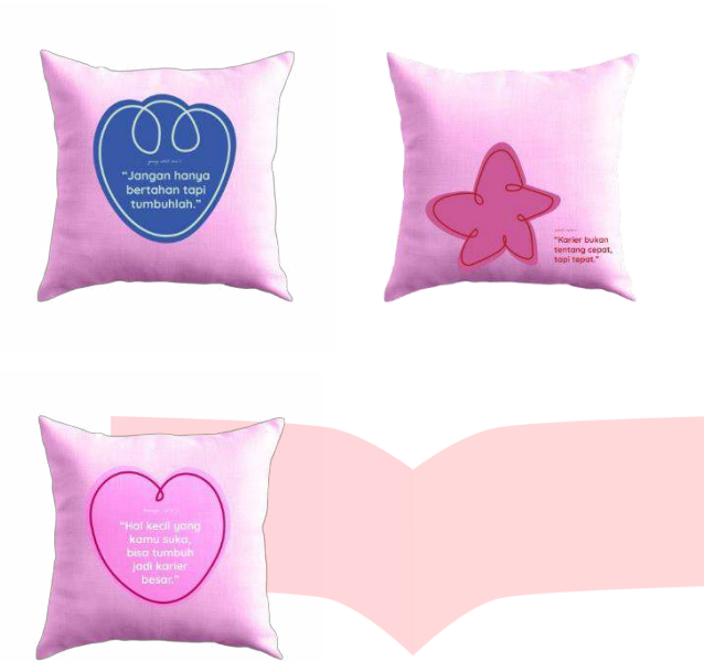
Gambar 10 : Sarung Bantal