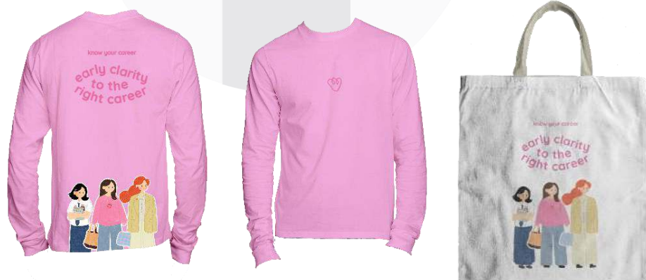
Gambar 5 : T-Shirt & Totebag