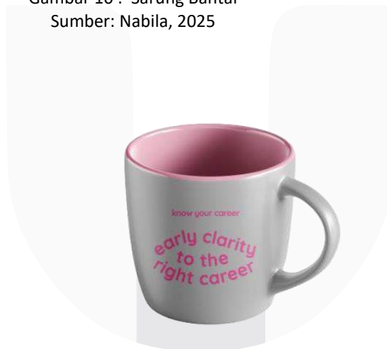
Gambar 11 : Mug Sumber: Nabila, 2025