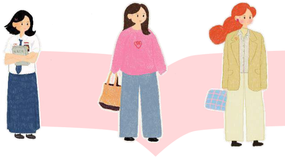
Gambar 2 : Desain Karakter