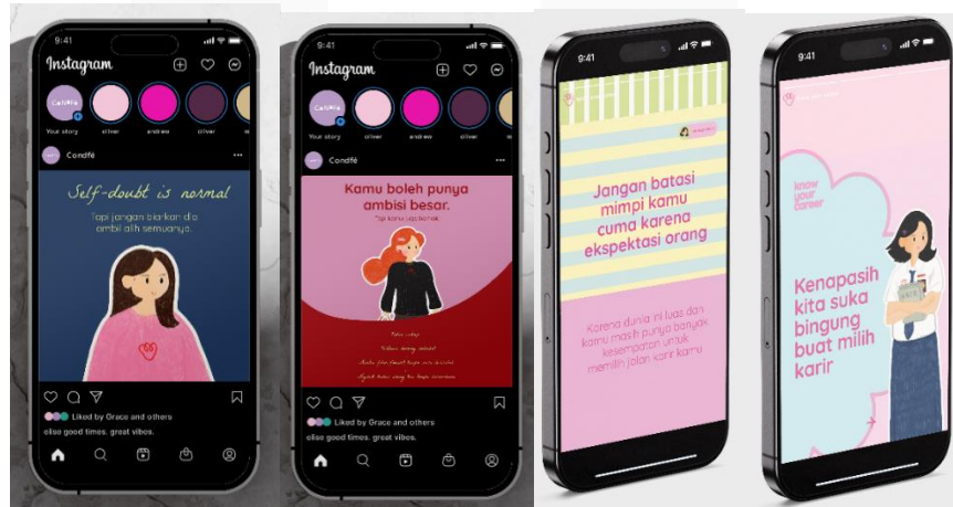
Gambar 3 : Konten Feeds