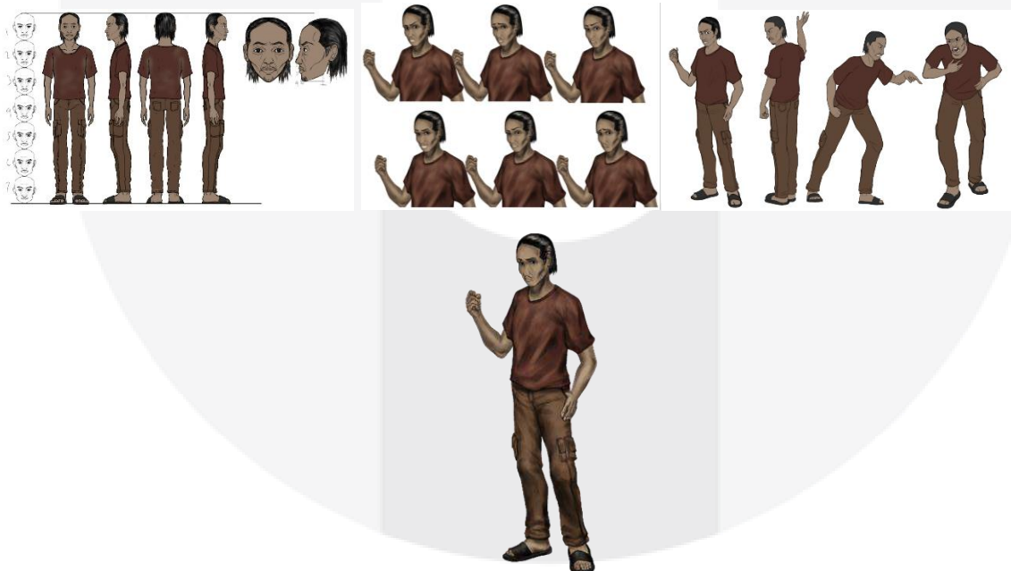
Gambar 4.3 Hasil Pengkaryaan Ayah Kirana