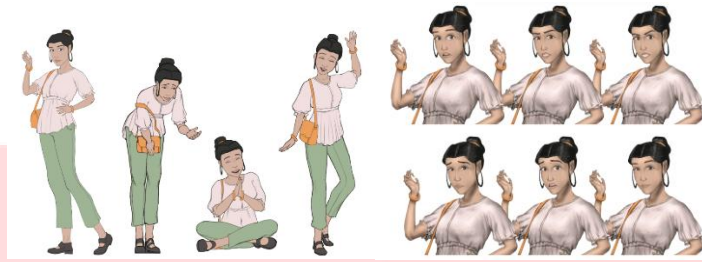
Gambar 4.2 Hasil Pengkaryaan Asih