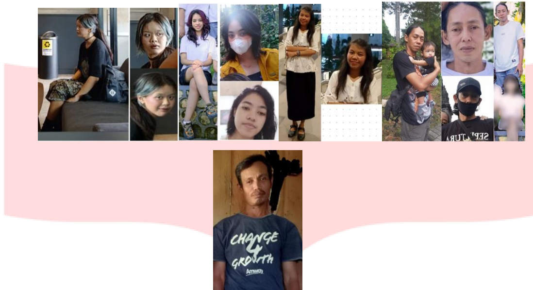
Gambar 3.1 Observasi narasumber korban beserta orang tua