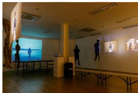
Gambar 2 Pameran Pusa Pusat Kertas

Perancangan film dokumenter ini tidak hanya mencatat perjalanan seni Setiawan Sabana tetapi juga menyajikan "The Paradox of Digital" dalam pengarsipan, di mana format digital, meskipun efisien dalam penyimpanan, bergantung pada perangkat dan perangkat lunak yang terus berubah, menimbulkan tantangan dalam jangka panjang terkait keamanan dan keberlanjutan aksesibilitas data. Film ini juga menyoroti pemikiran Setiawan Sabana yang mendalam tentang kertas sebagai simbol peradaban dan spiritualitas, serta perannya sebagai seorang guru besar dan mentor yang hangat namun tegas, yang gigih membimbing mahasiswanya dan menanamkan nilai-nilai kedisiplinan dan analisis mendalam. Konsistensi beliau dalam berkarya dan mengeksplorasi kertas sepanjang hidupnya juga menjadi poin penting yang diangkat.