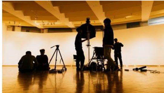
Gambar 1 Dokumentasi Produksi

Proses produksi melibatkan serangkaian tahapan mulai dari riset awal pada Juli 2024 hingga proses pasca-produksi yang berakhir Juni 2025. Lokasi pengambilan gambar dipilih berdasarkan keterkaitan Setiawan Sabana dan akses, meliputi kediamannya di Jl. Rebana No. 10 (Garasi Seni 10, perpustakaan, dapur, halaman depan), FSRD ITB (Galeri Soemardja, ruang arsip CIVAS ITB), Orbital Dago, FISS UNPAS, TPU Cibarunai, dan Helix Mesindo Studio. Tim produksi terdiri dari berbagai posisi, dengan perancang sebagai sutradara juga merangkap sebagai tim riset, line producer dan editor . Hasil perancangan visual film ini mencakup adegan-adegan yang secara naratif membangun pengenalan sosok Setiawan Sabana, eksplorasi karya, dan refleksi warisannya.