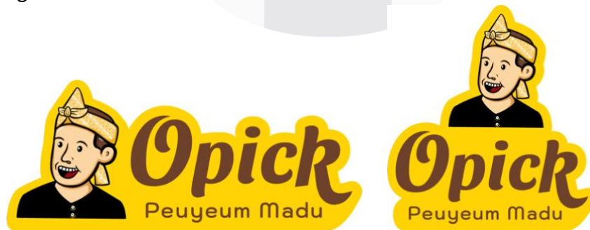
Gambar 3 Logo