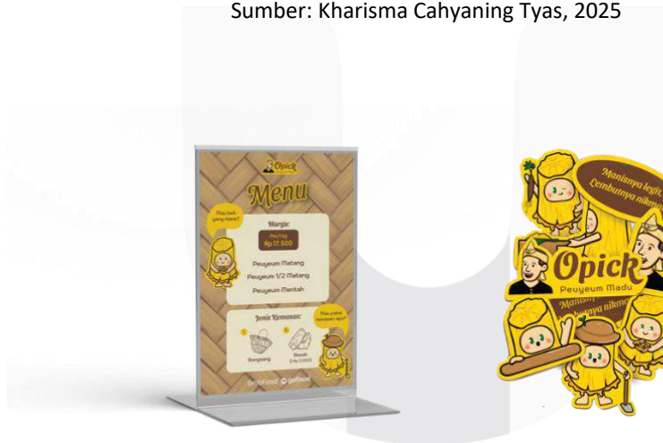
Gambar 7 Media Pendukung 3 Sumber: Kharisma Cahyaning Tyas, 2025