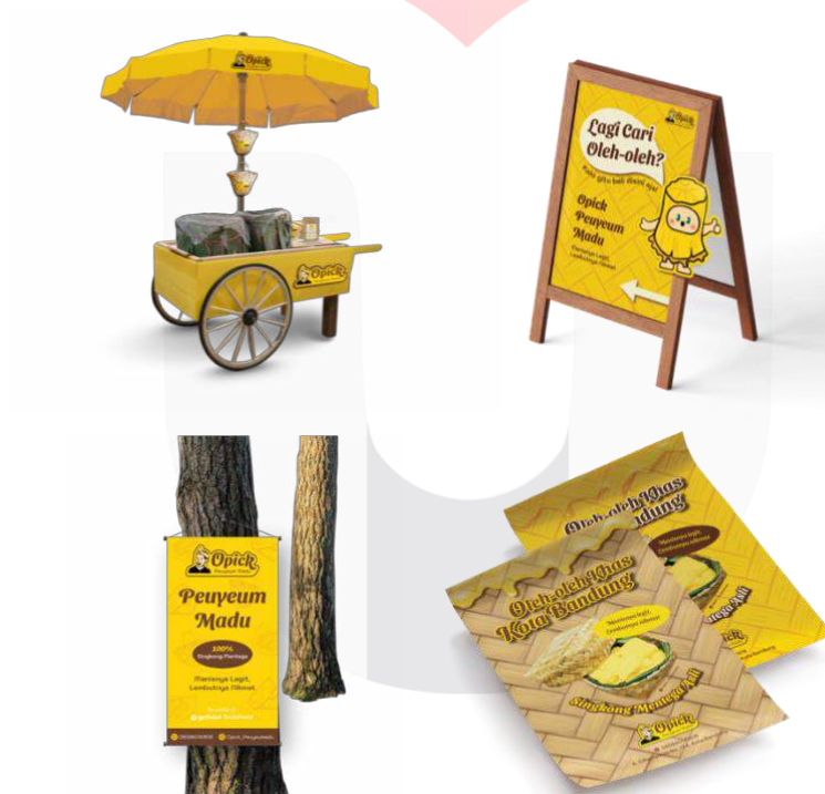
Gambar 5 Media pendukung 1