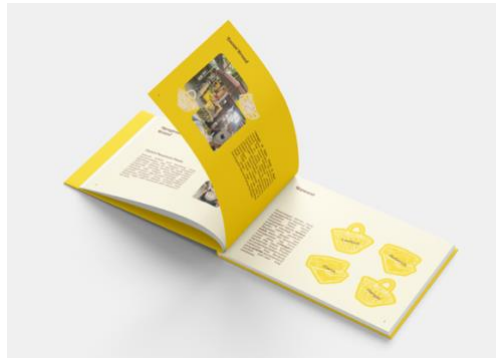
Gambar 4 Graphic Standard Manual