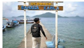
6:00 - 7:00 transisi ke dermaga menuju pulau pahawang