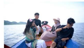
7:00 - 15:00 di kapal. mereka menggunakan sunscreen