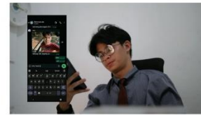
4:00 - 5:00 teman-temannya memberi kabar lalu rey berinisiatif mengajak mereka ke pahawang