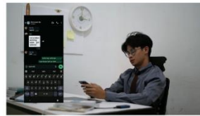
3:00 - 4:00 ia tiba-tiba teringat pada teman-teman lamanya dan mulai mengetik pesan di grup lamanya