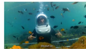
4:00 - 5:00 seawalker di pahawang