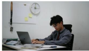
0:00 - 2:00 rey terlihat stress karena pekerjaannya