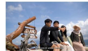
scene 1 menunjukkan keindahan pantai kelagian kecil