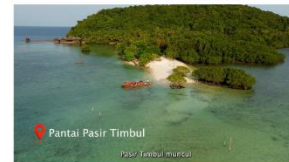
7:00 - 15:00 pantai pasir timbul