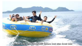
6:00 - 7:00 main donat boat di pahawang