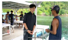
3:00 - 4:00 intruksi sebelum mencoba seawalker pertama kali