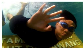
0:00 - 2:00 snorkeling di pahawang