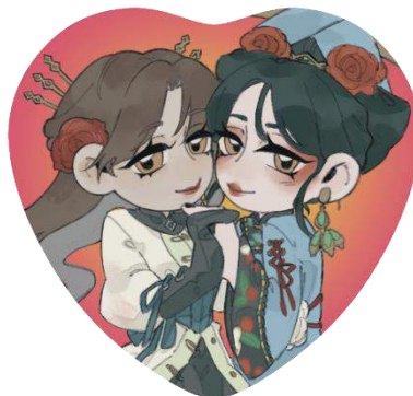
Gambar 9 Heart badge