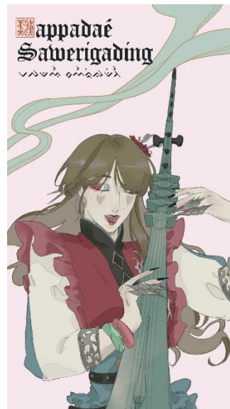
Gambar 1 Sampul komik digital Mappadae Sawerigading

sembronya, merasa bahwa dirinya tidak benar-benar memiliki tempat berpulang dan berusaha membuktikan jerih payahnya untuk meminang seorang putri dari negeri seberang pada orang tua dan saudari kembarnya We Tenriabeng agar ia mendapat pengakuan yang layak dari keluarganya. Konsep pesan dari komik digital ini yaitu menjadi komik yang bisa membantu remaja dewasa usia 18-25 tahun untuk memahami identitas diri mereka lebih dalam melalui narasi yang mudah dipahami, diselipi humor, serta digambarkan dengan gaya ilustrasi yang menarik.