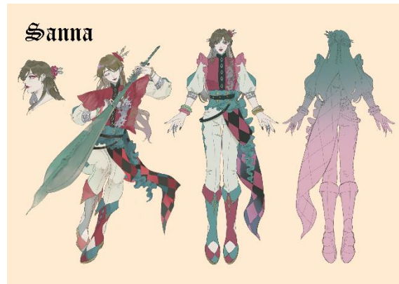
Gambar 2 Desain karakter Sanna

penggambaran detail-detail kecil di desain karakter, serta semiotika visual seperti sifat karakter yang dapat disimpulkan dari cara mereka berpakaian atau permainan warna-warna tertentu pada desain karakter.