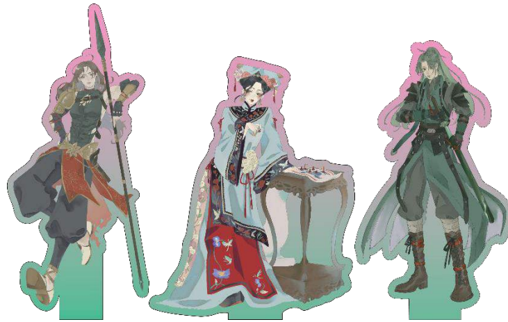
Gambar 7 Standee akrilik