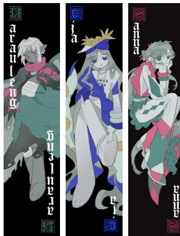
Gambar 5 Pembatas buku