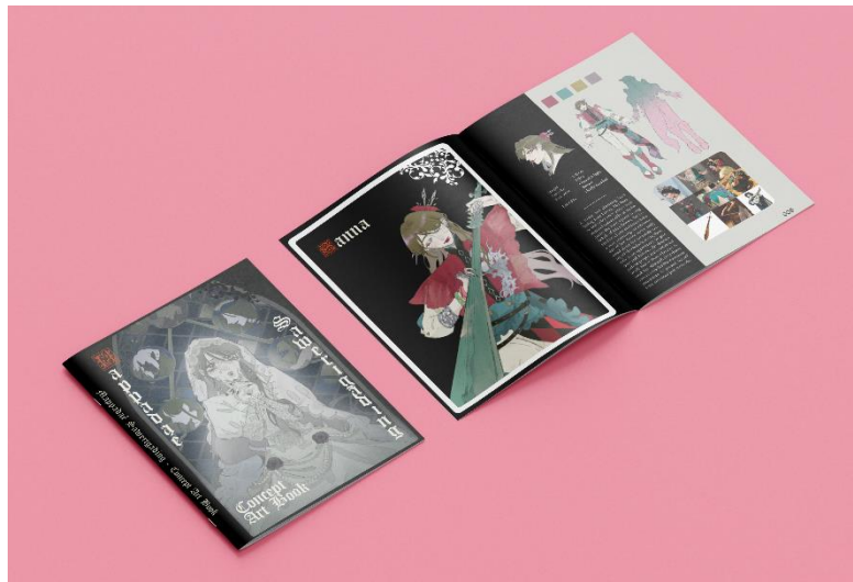
Gambar 10 Mockup buku konsep