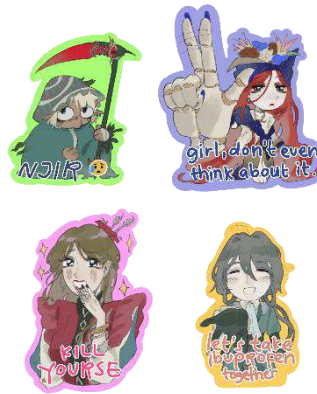
Gambar 4 Stiker die cut