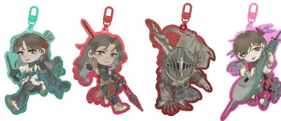
Gambar 3 Gantungan kunci akrilik

Untuk perancangan media pendukung dari karya utama, dilakukan penekanan pada promosi karakter dan gaya ilustrasi yang dibawakan untuk menarik minat pembaca. Karena komik yang sifatnya berbasis penokohan karakter dan ilustrasi yang menarik, media pendukung dirancang untuk mengenalkan tokoh-tokoh yang akan muncul dalam komik digital ini supaya pembaca juga merasa terikat dengan desain karakter yang ditampilkan.