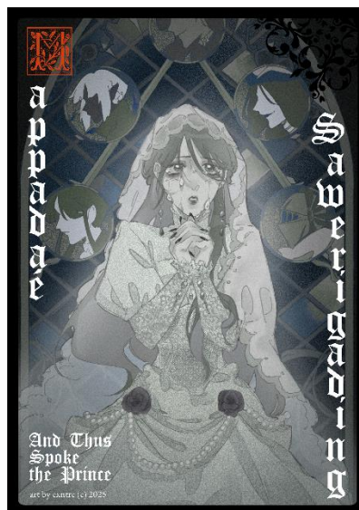
Gambar 11 Poster