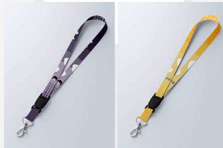
Gambar 9 Lanyard Sumber: Cut Titania Acehova, Juli 2025