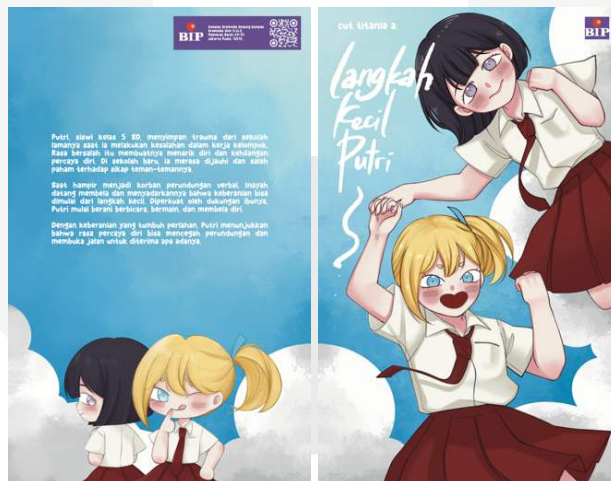
Gambar 3 Sampul Depan dan Belakang Komik