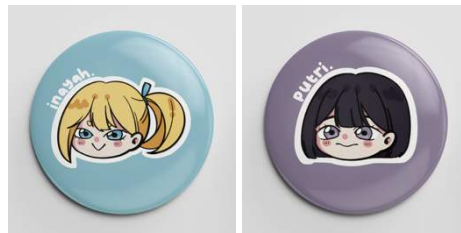
Gambar 10 Pin