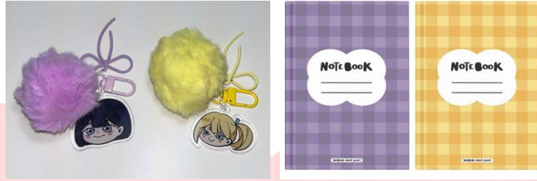
Gambar 7 Gantungan Kunci dan Notebook