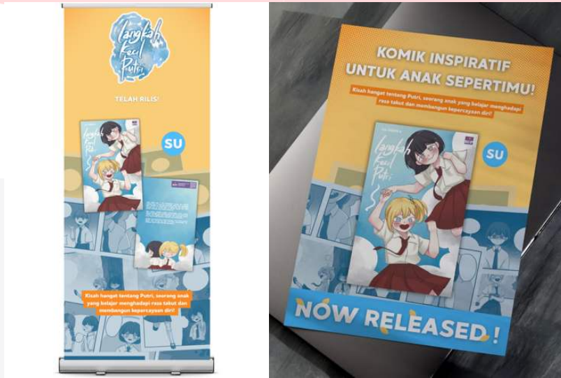
Gambar 8 X Banner dan Poster