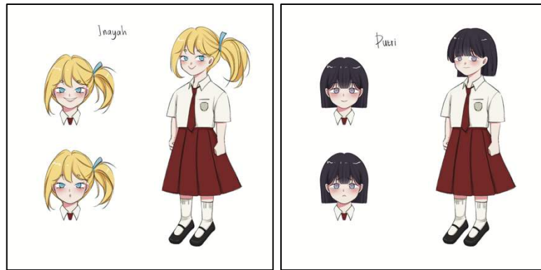
Gambar 5 Desain Karakter