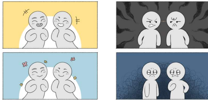
Gambar 1 Penerapan Warna