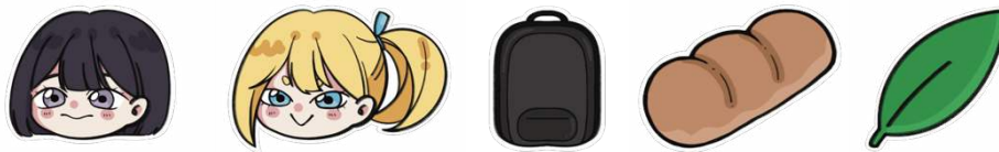
Gambar 6 Desain Stiker