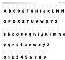
Gambar 2 Penerapan Warna

Tipografi dalam komik ini akan digunakan adalah Positif Forward. Font ini bersifat playful dan dapat terbaca dengan jelas.