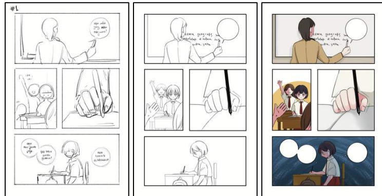
Gambar 4 Proses Kerja