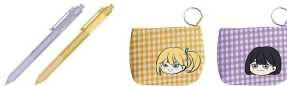
Gambar 11 Ballpoint dan Pouch