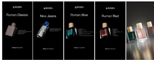
Gambar 5 Interactive Instagram Story

Reels instagram Basel digunakan sebagai media yang menjelaskan tentang produk dari basel, dan juga motion 3D yang memperlihatkan semua produk Basel.