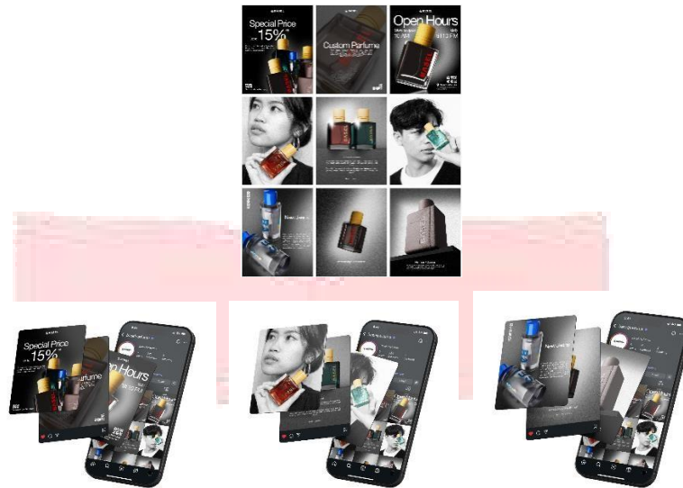
Gambar 3 Feeds Instagram

Feeds Instagram Basel digunakan untuk membagikan konten informasi dari Basel dengan dominan memperlihatkan produk dari Basel dengan harapan memperkenalkan produk Basel.