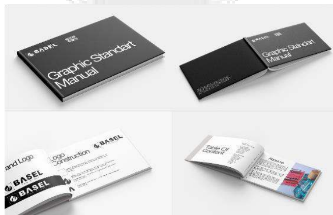
Gambar 2 Manual Book

Graphic Standard Manual merupakan kumpulan panduan visual yang dibuat untuk membantu Basel menjaga konsistensi identitas merek dalam setiap bentuk desain. Dokumen ini berisi aturan dan acuan dalam penggunaan elemen visual seperti logo, warna, tipografi, dan komposisi desain, yang bertujuan agar citra Basel tetap selaras dan mudah dikenali di berbagai media.