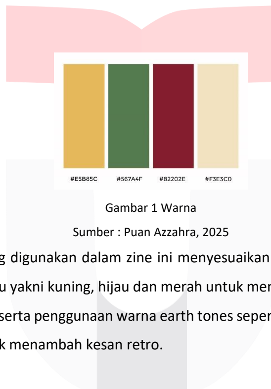
Gambar 1 Warna