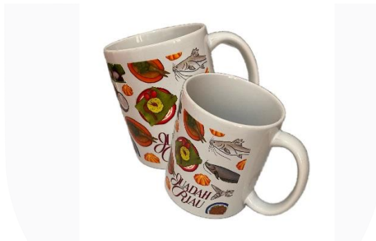
Gambar 13 Mug