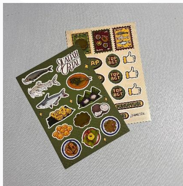
Gambar 9 Stiker