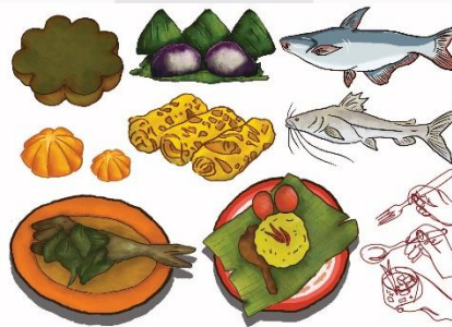
Gambar 4 Ilustrasi