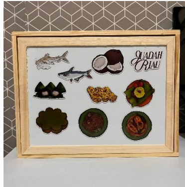
Gambar 12 Magnet Kulkas