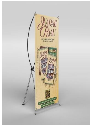
Gambar 8 X Banner