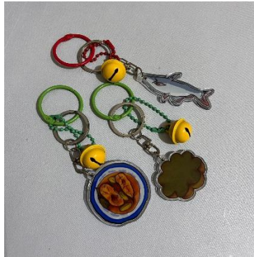
Gambar 10 Bagcharm