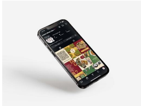
Gambar 6 Media Sosial