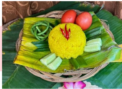
Gambar 3 Fotografi