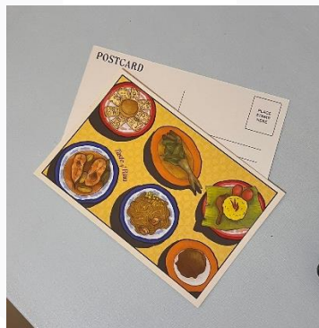
Gambar 11 Postcard