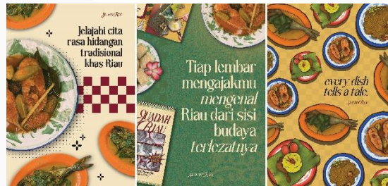
Gambar 7 Poster