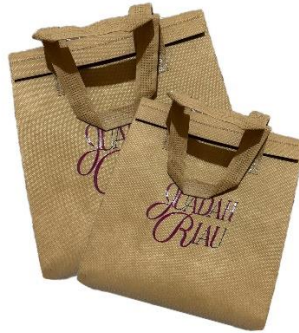
Gambar 14 Thermalbag