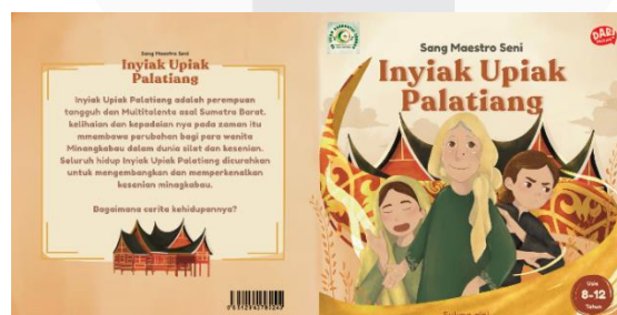
Gambar 1 Desain Sampul

Media ini dikemas dalam bentuk buku ilustrasi edukatif untuk anak usia 8–12 tahun. Isi buku dirancang dengan gaya visual storytelling dengan ilustrasi sebagai unsur utama untuk menyampaikan informasi yang akan disampaikan pada buku ini. hal yang diperhatikan pada perancangan buku ilustrasi ini adalah bentuk visual atau ilustrasi yang disesuaikan dengan target agar menarik minat dengan penggunaan sudut pandang orang pertama yaitu “aku” serta memastikan target memahami makna yang disampaikan pada buku.