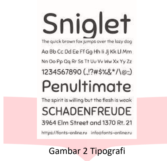
Gambar 2 Tipografi

ini dibuat bentuk kartun semi realis agar anak anak lebih bisa melihat dan membayangkan latar dan pesan dari cerita yang disampaikan.