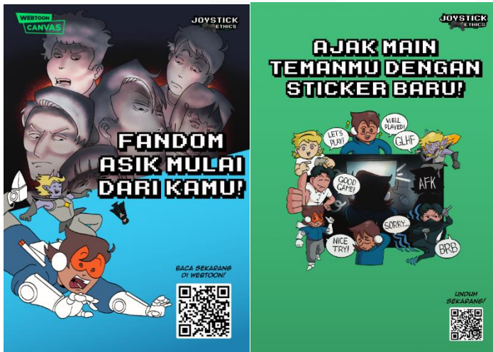
Sticker Chat Digital