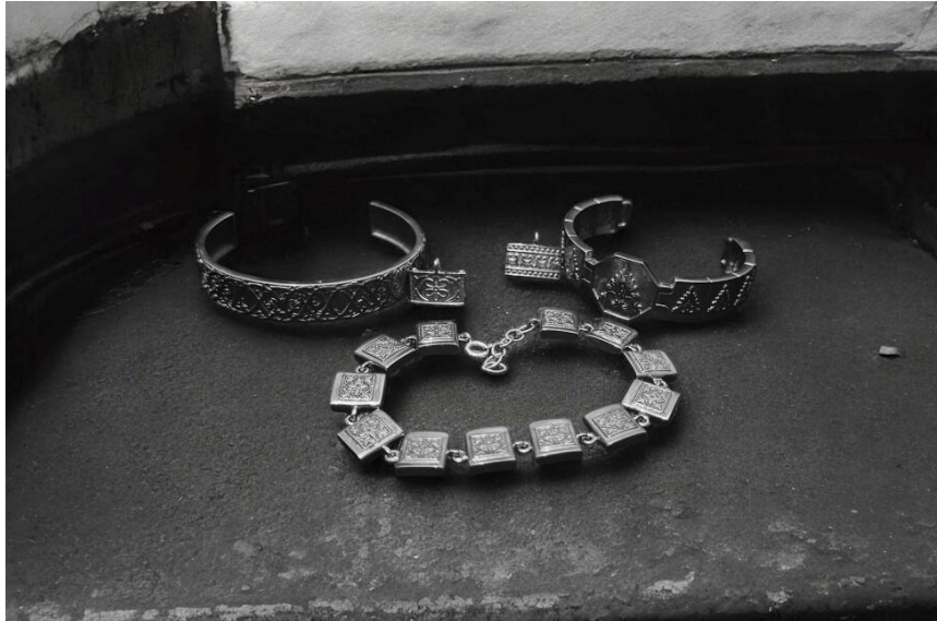
Gambar 6. Final Product

Gambar di atas ini menunjukkan hasil dari proses 3D modeling yang telah diterapkan ke dalam bentuk gelang fisik dengan sentuhan modern namun tetap mempertahankan unsur tradisional Minangkabau. Gelang ini menampilkan motif ukiran khas rumah gadang yang dipadukan dengan bentuk minimalis dan ergonomis, menjadikannya lebih relevan bagi generasi muda usia 18–29 tahun. Material yang digunakan adalah logam berwarna perak yang ringan dan elegan, sesuai dengan preferensi target pengguna yang menginginkan perpaduan antara estetika budaya dan kenyamanan dalam pemakaian sehari-hari. Visualisasi ini menegaskan keberhasilan pendekatan inovasi dan hibriditas budaya dalam merancang ulang perhiasan tradisional agar tetap bernilai namun relevan dengan gaya hidup masa kini.