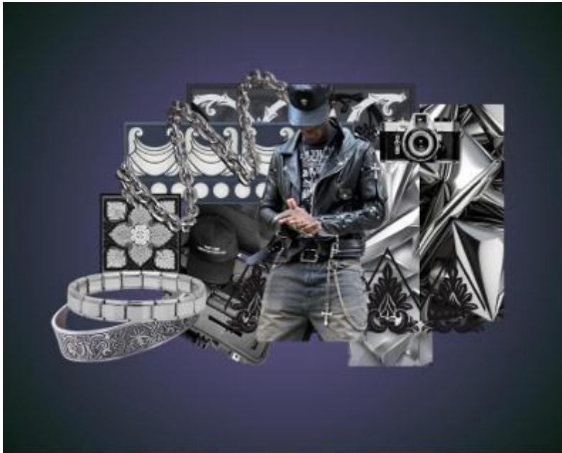
Gambar 2. Moodboard

Mood Board diatas adalah kumpulan visual yang mencerminkan nuansa dan inspirasi yang ingin dicapai dalam proses perancangan sebuah produk. Mood Board juga dapat membantu menciptakan identitas produk dan menjaga keselarasan desain selama proses perancangan. Saat proses perancangan, Mood Board dapat mencakup palet warna, bentuk, tekstur material.