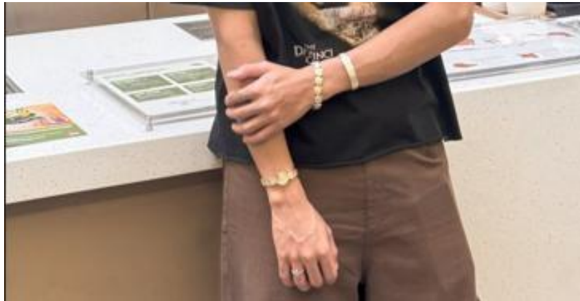
Gambar 6. Validasi Gelang

Proses validasi produk bertujuan untuk menilai sejauh mana desain Minangkabau Modern Bracelet dengan motif ukiran rumah gadang berhasil mencapai tujuan perancangannya, terutama dalam hal estetika, kenyamanan, kemudahan pemakaian, dan nilai budaya yang diwakilinya. Validasi ini dilakukan dengan melibatkan beberapa orang penggiat tren perhiasan berusia 18–29 tahun yang merepresentasikan target pengguna, melalui metode wawancara mendalam, observasi langsung saat penggunaan, serta pendokumentasian secara visual.