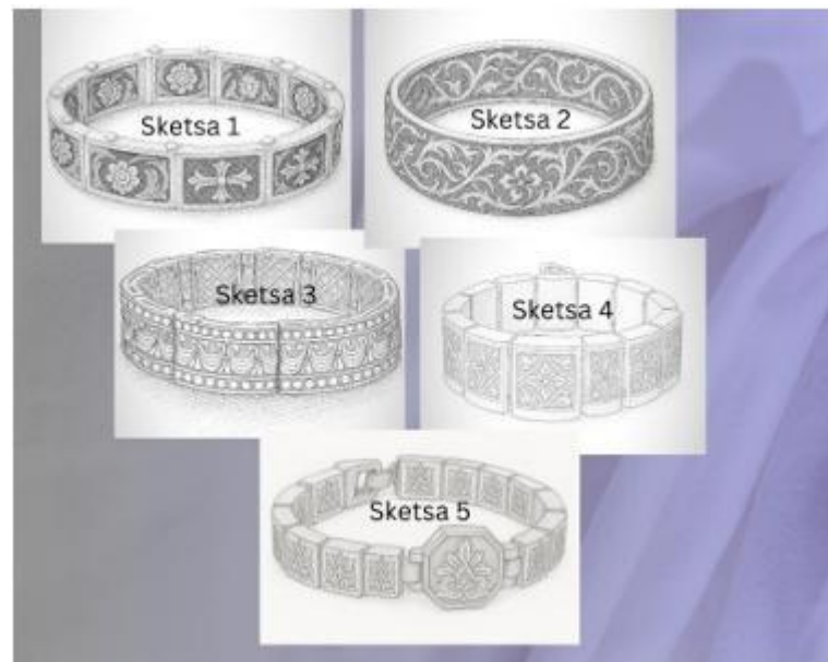
Gambar 4. Sketsa 1-5

Mind mapping adalah teknik visual untuk mengorganisasi ide atau informasi dengan membuat diagram bercabang dari satu ide utama, mempermudah pemahaman dan meningkatkan kreativitas. Berikut adalah mind mapping dalam perancangan perhiasan tradisional (gelang) untuk dapat menarik minat usia muda. Pengembangan desain perhiasan tradisional Minangkabau untuk usia muda bertujuan melestarikan budaya dengan pendekatan modern yang sesuai dengan selera generasi 18–29 tahun. Desainnya menggabungkan nilai estetika dan filosofi budaya dalam bentuk yang praktis, ergonomis, dan trendi, menggunakan material tahan lama seperti perak alpaka. Proses produksi memanfaatkan teknologi modern seperti CAD dan 3D printing, dipadukan dengan teknik handmade pengrajin lokal, serta melalui tahapan prototipe dan iterasi. Produk ini ditujukan bagi mahasiswa, pekerja muda, pencinta budaya lokal, dan kolektor yang mengutamakan nilai historis, estetika, dan kenyamanan.