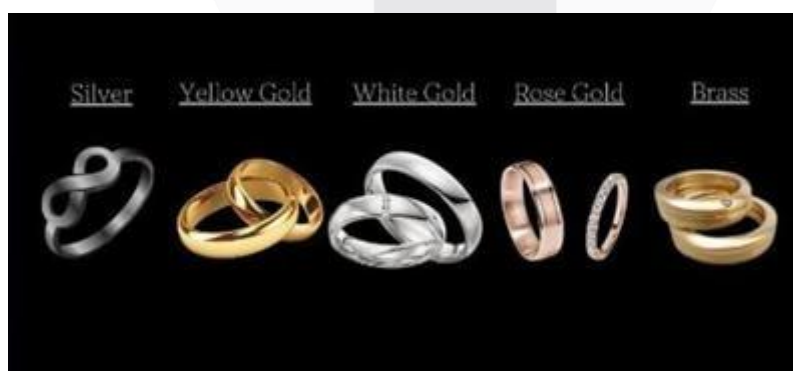
Gambar 1. Diagram Preferensi Material

Hasil pengumpulan data melalui observasi, wawancara mendalam, dan penyebaran kuesioner kepada responden usia 18–29 tahun menunjukkan bahwa perhiasan tradisional Minangkabau mulai kehilangan daya tarik di kalangan generasi muda. Mayoritas responden mengapresiasi nilai budaya yang terkandung dalam perhiasan tradisional, namun menganggap bentuk dan ukuran perhiasan tersebut tidak praktis untuk dipakai sehari-hari. Desain yang terlalu besar, berat, dan kaku menjadi alasan utama ketidaktertarikan. Dari data kuesioner, sebanyak 82% responden menyatakan minat terhadap perhiasan tradisional yang dimodifikasi secara modern. Mereka menyukai desain yang lebih sederhana, ringan, serta bisa dipadukan dengan gaya berbusana kontemporer. Material seperti perak, resin, dan logam alternatif juga lebih diminati dibandingkan emas, karena dinilai lebih ringan, terjangkau, dan estetik.