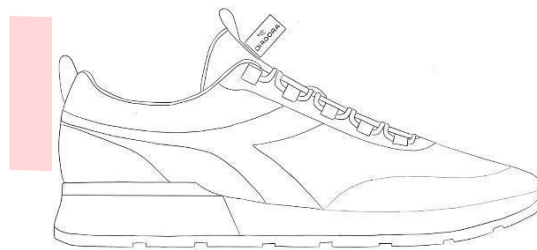
Gambar 4

cut dengan kombinasi material suede di bagian toecap dan vamp, Corduroy pada quarter, dan corduroy di area collar dan tongue. Outsole menggunakan mold rubber existing milik Diadora untuk efisiensi produksi. Warna utama terdiri dari maroon dan earth brown , dipadukan dengan aksent warna kuning terang di bagian heel tab sebagai elemen pop-up yang memberikan daya tarik visual. Panel-panel pada upper dibuat dengan struktur overlay yang mengikuti arah gerak kaki untuk menambah kenyamanan.