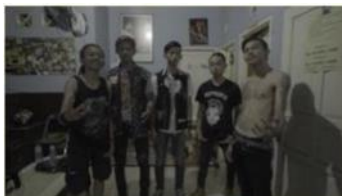
ANAK BAND PUNK