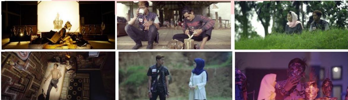
Gambar 4.7.3 Screen Shoot Film.