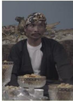
Rsus Colon Bueoti