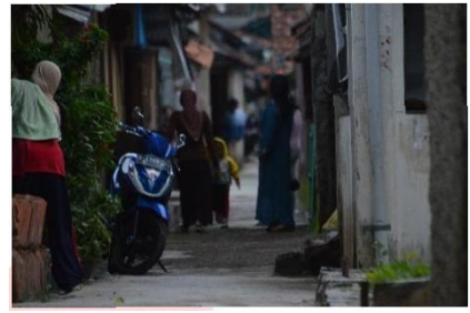
Gambar 4.7.2 Lokasi.