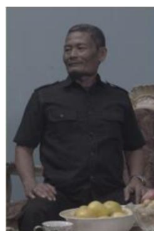
Rambo Pensowol bueoti