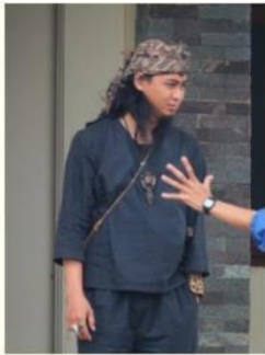
Bothorn penselolo podepokon