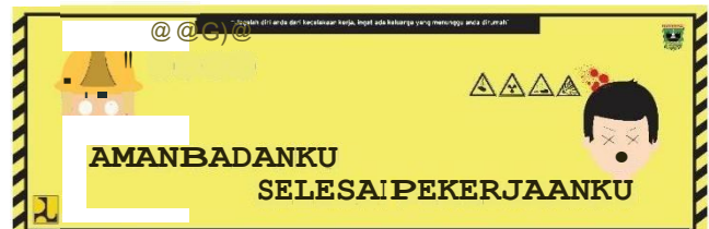
Gambar 9 Spanduk