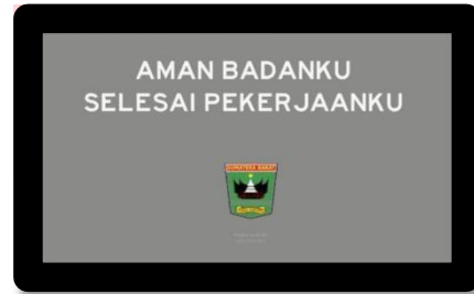
Gambar 7 scene keenam