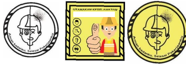
Gambar 10 Sticker