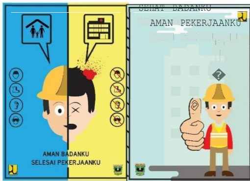
Gambar 8 Poster