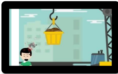
Gambar 6 scene kelima