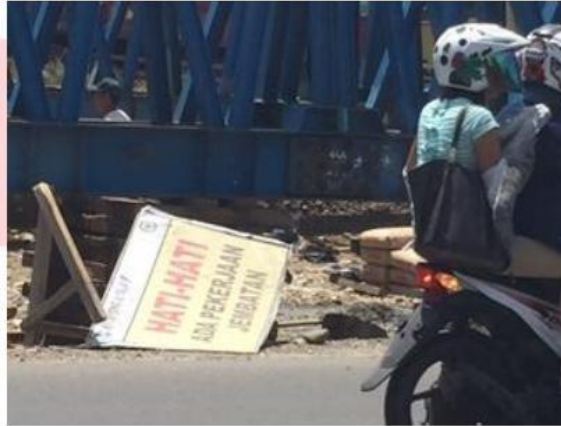
Gambar 1 Foto petunjuk keselamatan saat ini

Hasil wawancara dengan bapak Ir.Suprpto,MM (kepala dinas Pekerjaan Umum Provinsi Sumbar) diketahui 5 tahun belakangan ini ada sekitar lebih kurang 40 korban akibat kecelakaan kerja dan kelalaian masyarakat, diantaranya 10 meninggal dan 30 luka-luka. Korban meninggal rata-rata anak kecil berumur dibawah 15 tahun. Korban dewasa luka akibat kelalaian dan kecelakaan kerja adalah sekitar 30 orang. Setelah dicari penyebab diketahui petunjuk keselamatan proyek sangat minim, pengetahuan pekerja dan masyarakat sekitar tentang petunjuk keselamatan proyek sangat rendah, Masih kurangnya kesadaran masyarakat dan pekerja kontruksi dalam mematuhi larangan petunjuk keselamatan ( signage ) dan masih saja melanggar di sekitaran proyek Bina Marga yang menjadi penyebab kecelakaan kerja.