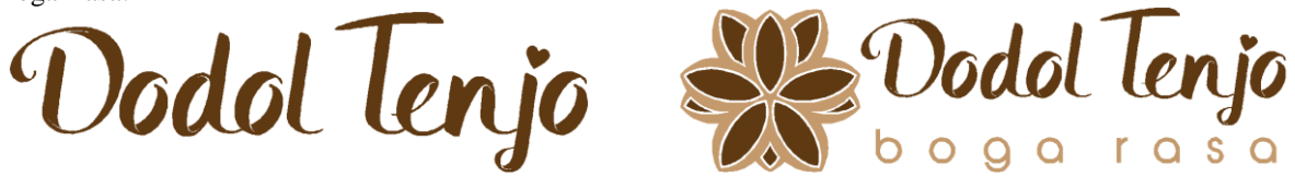
Gambar 9 Pengaplikasian logo IRT. Boga Rasa dengan Logotype Dodol Tenjo

Selain logo perusahaan diperlukan juga logotype untuk nama produk Berikut adalah logotype Dodol Tenjo yang sedikit dimodifikasi pada bagian titik huruf “J” dan pengaplikasian logotype Dodol Tenjo dengan Logo IRT. Boga Rasa: