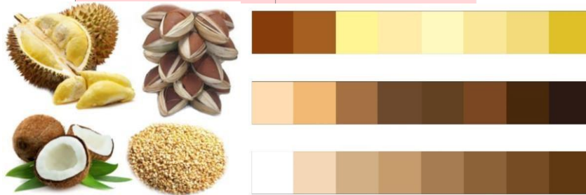
Gambar 2 Skema Warna

Warna merupakan salah satu hal terpenting dalam sebuah korporat dan kemasan. Selain dapat menjadi daya tarik, warna juga dapat mempertegas karakter produk Dodol Tenjo. Skema warna yang digunakan pada perancangan identitas visual Dodol Tenjo Produksi IRT. Boga Rasa diambil dari warna bahan baku Dodol Tenjo yang diproduksi IRT. Boga Rasa. Bahan-bahan tersebut adalah tepung ketan, gula aren, santan kelapa, biji wijen dan buah durian. Berikut gambar dari referensi bahan-bahan untuk membuat dodol: