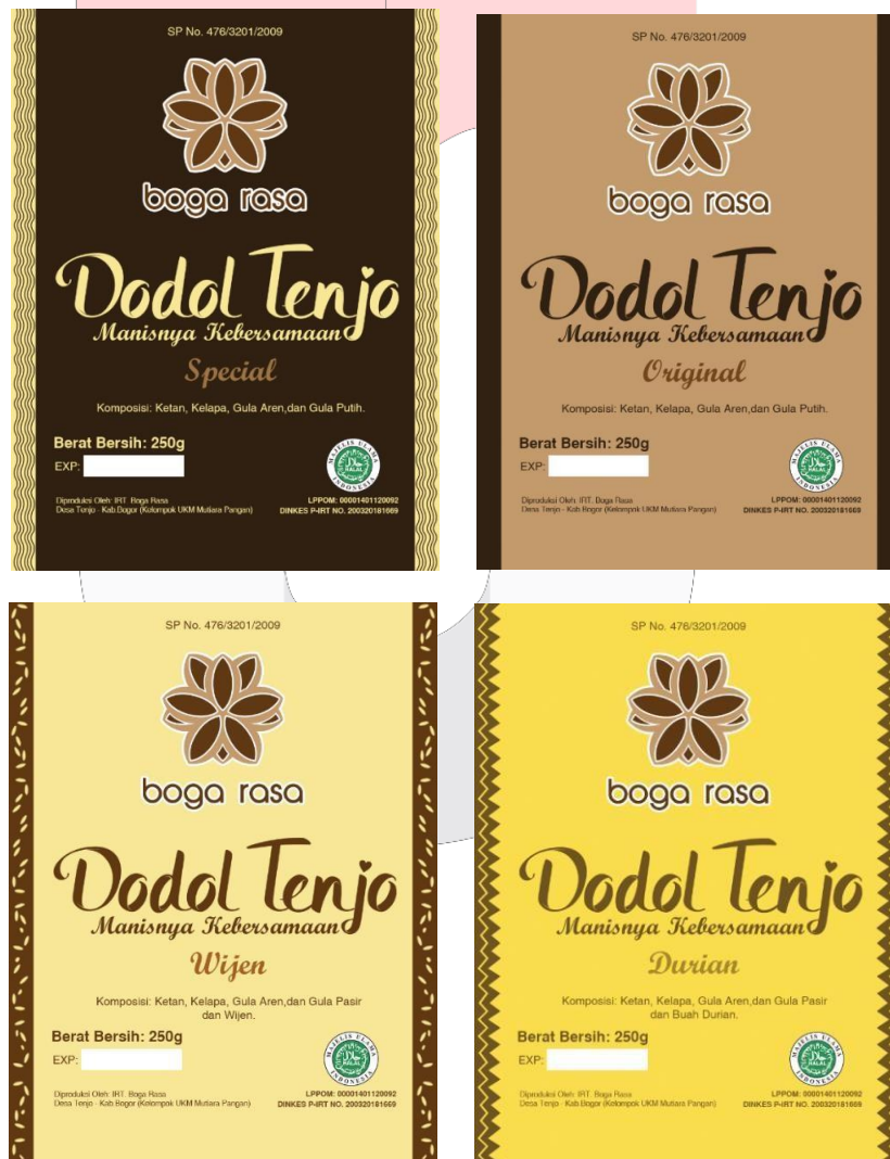
Gambar 10 Desain label kemasan primer Dodol Tenjo

Kemasan produk Dodol Tenjo sangatlah khas sehingga sulit untuk membuat bentuk lain selain dari bentuk yang sudah ada, hanya saja dilakukan perubahan pada desain label yang akan digunakan pada kemasan primer. Berikut adalah desain label untuk kemasan primer yang baru, dibagi menjadi empat sesuai dengan rasa Dodol Tenjo yang diproduksi oleh IRT. Boga Rasa: