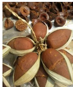
Gambar 1 Gula Aren

Bentuk logo pada perancangan identitas visual IRT. Boga Rasa terinspirasi dari bahan baku yang digunakan untuk membuat dodol yaitu gula aren, karena tidak setiap tempat produksi menggunakan gula aren asli dari desa-desa penghasil gula aren yang berkualitas. Bentuk gula aren yang digunakan oleh IRT. Boga Rasa berbeda dari bentuk gula aren pada umumnya, untuk lebih jelasnya berikut adalah gambar dari gula aren yang digunakan IRT. Boga Rasa dalam membuat dodol: