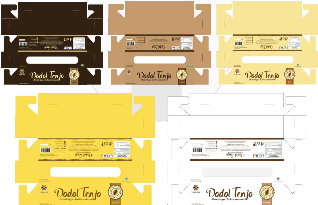
Gambar 12 Desain kemasan sekunder Dodol Tenjo

Setelah menentukan Stuktur yang digunakan dan ukuran yang akan digunakan maka proses selanjutnya adalah membuat visual dari kemasan sekunder agar dapat terlihat lebih menarik perhatian calon konsumen. Berikut adalah hasil dari visual kemasan sekunder sesuai dengan rasa pada Dodol Tenjo: