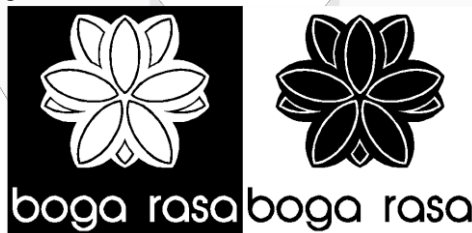
Gambar 7 Black and White Logo IRT. Boga Rasa

Berdasarkan hasil pengamatan terhadap logo-logo perusahaan yang bergerak dalam bidang kuliner, banyak yang menggunakan penggabungan ikon dan tipografi menjadi sebuah logo. Dibutuhkannya logotype guna mempertegas nama dari perusahaan tersebut. Untuk memperkuat logotype dibutuhkan sebuah ikon yang dapat mewakili IRT. Boga Rasa. Karena tidak setiap produsen menggunakan gula aren asli dan sama seperti gula aren yang digunakan oleh IRT. Boga Rasa, gula aren yang digunakan adalah gula aren terbaik yang didatangkan langsung dari desa ciboleger dan desa kanekes (baduy) Kecamatan Rangkas Bitung, Kabupaten Lebak, Banten. Dari berbagai studi ikon terhadap bentuk gula aren maka dipilihlah salah satu ikon yang dapat mewakili gula aren yang digunakan oleh IRT. Boga Rasa. Dari penggabungan antara logotype dan ikon maka hadir lah visual logo yang baru dan berikut adalah visual logo Black and White :