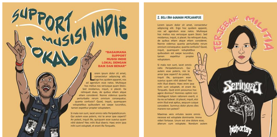
Gambar 3. Isi Buku 2