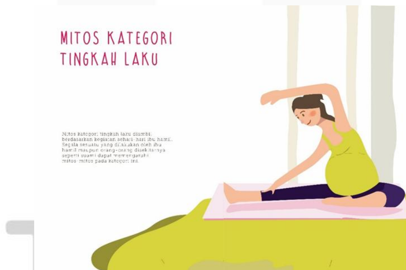
Gambar 3. Desain Isi Buku 3

Pada halaman daftar isi menggunakan ilustrasi di dalamnya. Font tersebut menggunakan font yang tidak terlalu formal karena isi dalam buku ini menggunakan bahasa yang mudah dipahami.