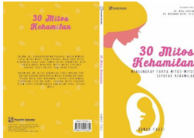
Gambar 1. Cover Buku

Cover di atas menggunakan ilustrasi ibu hamil dan bayinya yang masih dalam kandungan dengan gaya feminim. Font untuk judul buku mengikuti karakteristik feminin pada wanita. Warna yang digunakan dominan kuning, pink dan putih. Kuning memberikan kesan bersahabat dan cerdas, pink memberikan kesan wanita feminim, putih memberikan kesan bersih dan netral. Informasi yang terdapat dalam cover meliputi nama dokter pengantar untuk penjelasan fakta mengenai mitos kehamilan, judul buku dan sub judul, nama penulis, logo penerbit, barcode harga, serta sinopsis.