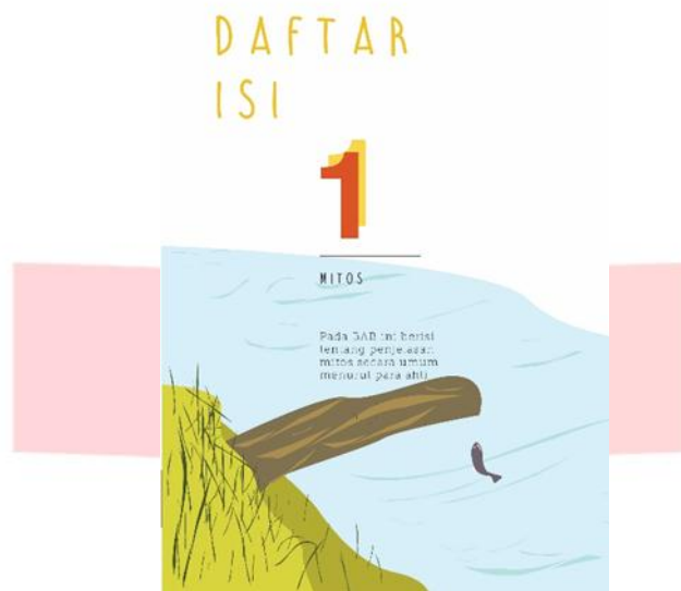
Gambar 2. Desain Isi Buku2

Pada halaman daftar isi menggunakan ilustrasi di dalamnya. Font tersebut menggunakan font yang tidak terlalu formal karena isi dalam buku ini menggunakan bahasa yang mudah dipahami.