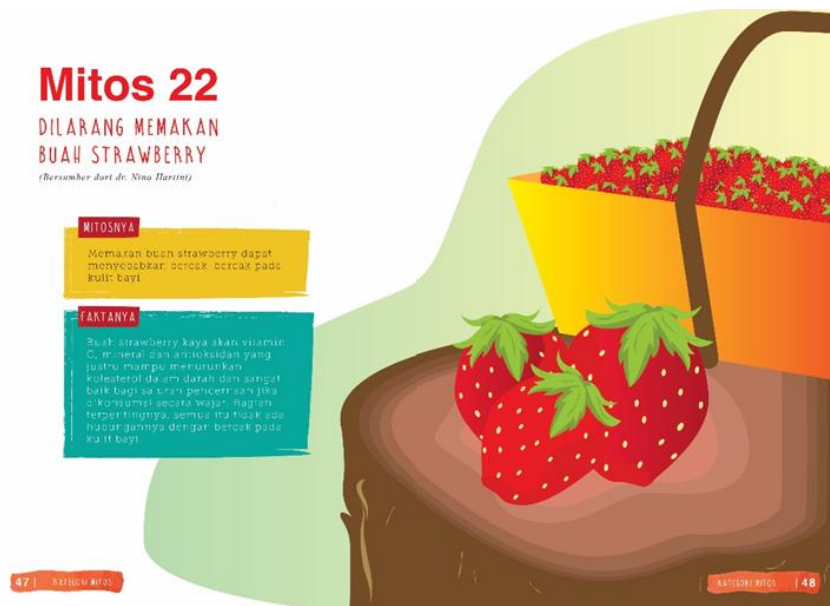
Gambar 4. Desain Isi Buku 4

Pada halaman penjelasan mitos terdiri dari nomor mitos, mitos yang ditakutkan, sumber informasi, penjelasan mitos dan fakta yang juga menggunakan elemen ilustrasi. Warna yang digunakan untuk nomor mitos dan mitosnya mengikuti warna dominan ilustrasinya. Kotak yang berbeda warna menjadikan pembeda antara mitos dan fakta.