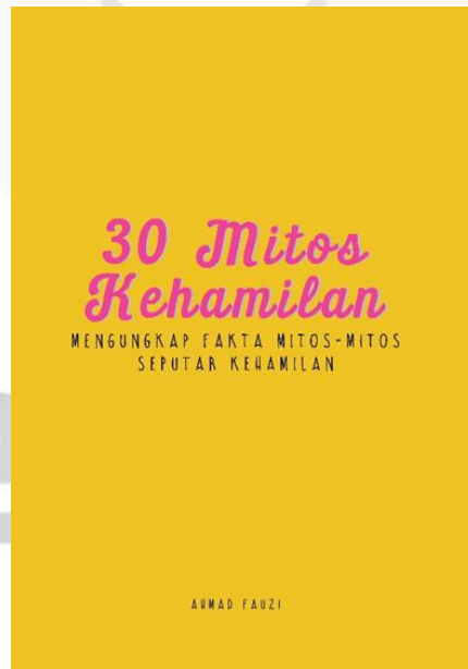
Gambar 2. Desain Isi Buku

Halaman judul singkat menggunakan font judul, sub judul dan nama penulis dengan dominan warna kuning dan pink mengikuti halaman cover depan agar konsisten.