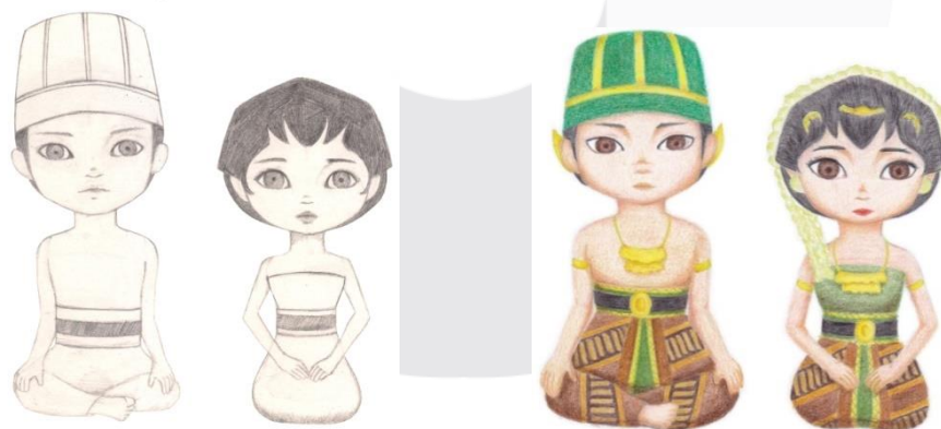
Gambar 1 Sketsa dan Ilutrasi Loro Blonyo

Media utama perancangan ini yaitu buku ilustrasi. Buku ini berukuran 20x20 cm dengan spesifik bahan buku menggunakan kertas BW dan bagian cover dilaminasi doff.. Proses pembuatan buku ini dimulai dengan membuat ilustrasi Loro Blonyo, ilustrasi tata upacara, ilustrasi perlengkapan dan ilustrasi pendukung.