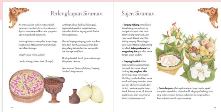
Gambar 6 Layout Buku

Pada layout penulis ingin lebih menonjolkan ilustrasi yang bertujuan untuk memperlihatkan apa-apa yang terdapat dalam pernikahan Yogyakarta. Pada layout penulis ingin lebih menonjolkan ilustrasi yang bertujuan untuk memperlihatkan apa-apa yang terdapat dalam pernikahan adat Jawa.