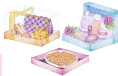
Gambar 3 Aplikasi Warna

Warna yang digunakan yaitu mengambil warna-warna khas Jawa dan juga memakai warna-warna pastel yang identik dengan tema warna pernikahan. Warna pastel diambil karena memiliki kesan feminim.