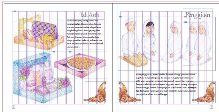
Gambar 7 System Grid Layout

Pada layout penulis ingin lebih menonjolkan ilustrasi yang bertujuan untuk memperlihatkan apa-apa yang terdapat dalam pernikahan Yogyakarta. Pada layout penulis ingin lebih menonjolkan ilustrasi yang bertujuan untuk memperlihatkan apa-apa yang terdapat dalam pernikahan adat Jawa.