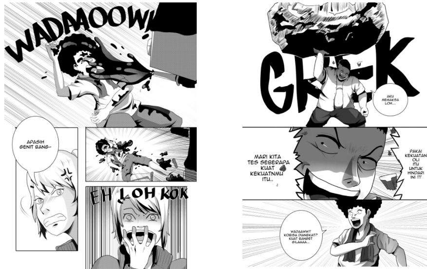
Gambar 2. Isi Buku 1