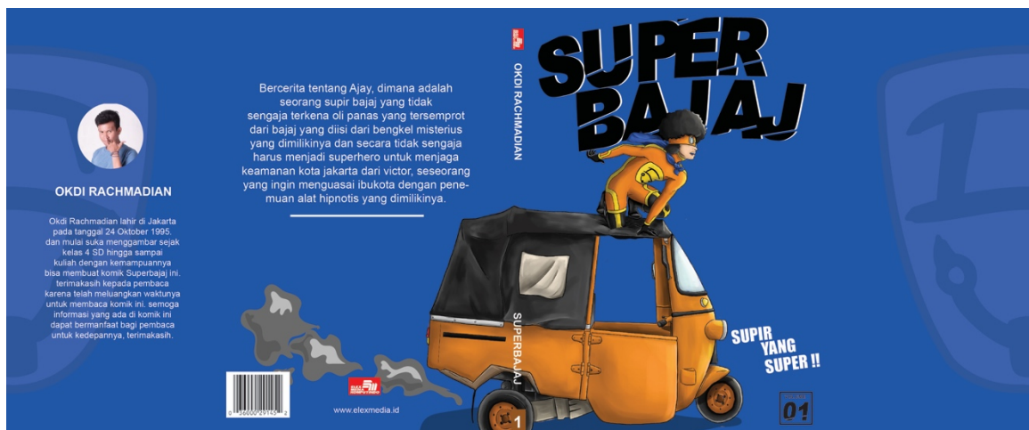
Gambar 1 . Rancangan Jacket + Cover Buku