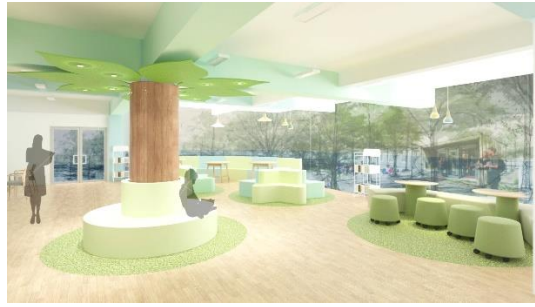
Gambar 4.5 Perspektif Lobby