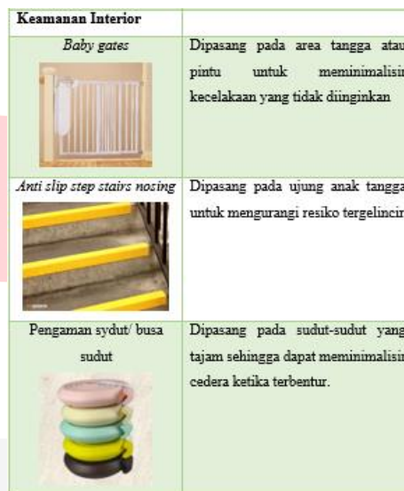
Gambar 3.2 konsep Keamanan

Konsep keamanan pada Daycare dan Preschool ini berdasarkan analisa dari studi banding penulis dan kebutuhan anak-anak dalam hal keamanan.