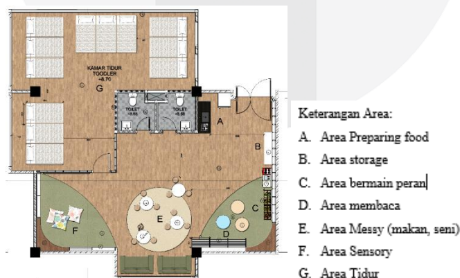
Gambar 4.1 Denah Khusus Toodler Daycare

Area ini merupakan area Toodler Daycare Yang mewakili tema di daycare di setiap ruangan tersedia area tidur anak, area makan, toilet serta area bermain dan belajar. Daycare di desain lebih ceria di banding ruang kelas karena dalam ruang kelas anak-anak harus lebih terfokus untuk belajar menerima pelajaran.