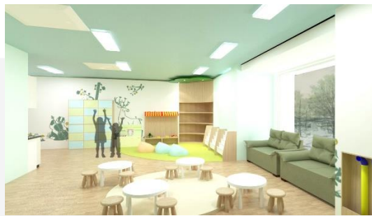
Gambar 4.3 Perspektif Toodler Daycare Sumber: Analisa Penulis, 2017