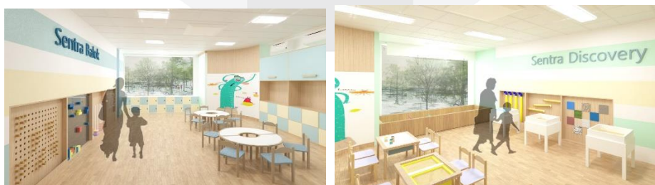
Gambar 4.4 Ruang kelas

Desain pada ruang kelas di buat dengan suasana fun dan relaxing, layout pada ruang kelas juga dibuat minim furniture sehingga anak-anak lebih leluasa untuk bereksplorasi dalam kelas. Dan penggunaan warna kuning dan biru dapat membantu anak-anak untuk lebih fokus.