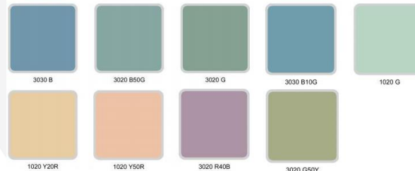
Gambar 3.1 pallete warna anak berkebutuhan khusus autism

Konsep warna dipilih disesuaikan dengan kondisi anak berkebutuhan khusus karena warna memiliki efek psikologis tersendiri untuk anak berkebutuhan khusus. warna yang digunakan mengacu kepada warna berkebutuhan khusus autisme karena warna autisme cocok digunakan untuk anak berkebutuhan khusus lainnya dan anak normal. Warna hijau dan biru dipilih menjadi warna utama karena memiliki shooting effect yang baik untuk anak berkebutuhan khusus.