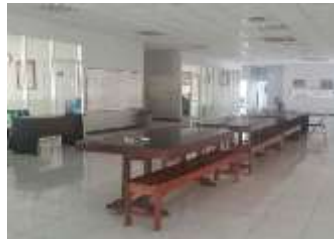
Gambar 5.5 : Ruang Salesman Sesudah