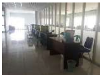
Gambar 5.8 : Area Marketing Sebelum

Kebutuhan ruang tim promosi meliputi area meja kerja, jalur sirkulasi, dan area arsip file.. Pintu masuk ditempatkan diantara divisi supervisor dan officer, ditempatkan di pertengahan ruang divisi agar bagi pegawai tidak mendapatkan jalur sirkulasi yang panjang. langsung mendapatkan pengarahannya dari resepsionis dan dapat mengutarakan maksud kedatangan. Zona ruang kerja tim promosi memiliki jalur sirkulasi.. Nuansa yang dicapai pada ruang team promosi ini berorientasi tema simpel, sederhana, open plan dan menunjukkan identitas diri kantor dan tetap memberikan estetika yang mengikuti zaman. Penggunaan material karpet polos pada area divisi marketing dimaksudkan untuk pemberian estetika kepada ruangan dengan memberikan custom kepada lantai karpet. Karpet dipilih juga untuk meminimalisir kebisingan yang ada. Jadi alasan pemilihan keramik adalah untuk meminimalisir kebisingan dan menunjukkan identitas kantor melalui warna yang polos.