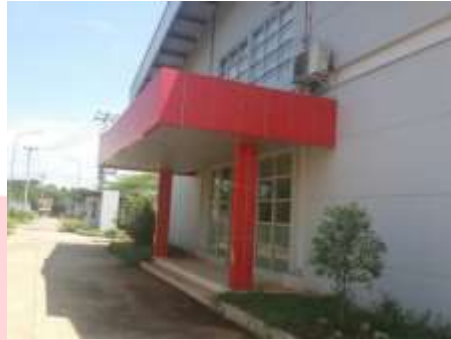
Gambar 4.1 Gedung Kantor Rokok Apache cabang Cirebon