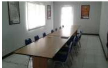
Gambar 5.11 : Ruang Rapat Sebelum

Konsep yang diaplikasikan di ruang rapat ini adalah menunjukkan kestabilan antara brand dan corporate di dalam ruang agar terlihat dari nilai dari identitas kantor dan brand. Tata letak yang ada pada ruang rapat ini meliputi area meja rapat, dan area presentasi. Ruang rapat ini terbagi menjadi 2 ruangan, yaitu ruang rapat bisnis, dan ruang rapat internal. Ruang rapat ini menggunakan partisi geser untuk mebaginya menjadi 2 ruangan. Menggunakan dinding kaca frameless agar dapat memberikan kesan luas pada ruang. Nuansa yang dicapai pada ruang rapat ini berorientasi pada tema menunjukkan identitas diri kantor dan tetap memberikan estetika yang mengikuti zaman. Penggunaan material karpet polos pada area ruang rapat dimaksudkan untuk pemberian estetika kepada ruangan dengan memberikan custom kepada lantai karpet. Karpet dipilih juga untuk meminimalisir kebisingan yang ada. Jadi alasan pemilihan keramik adalah untuk meminimalisir kebisingan dan menunjukkan identitas kantor melalui warna yang polos.