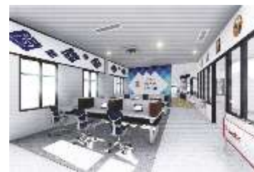
Gambar 5.9 : Area Marketing Sebelum