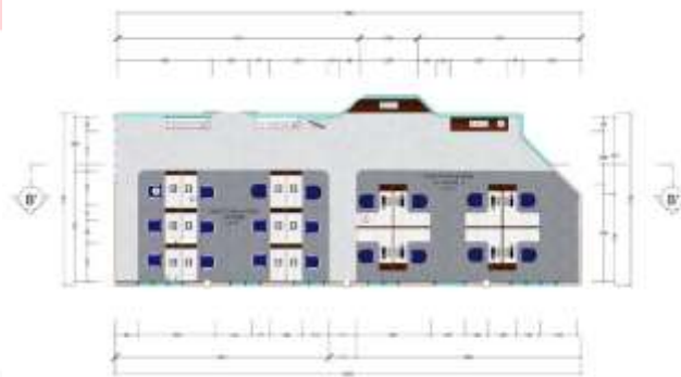
Gambar 5.7 : Layout Denah Khusus Ruang Team Marketing Promosi (Sumber : Pribadi 2018)

Kebutuhan ruang tim promosi meliputi area meja kerja, jalur sirkulasi, dan area arsip file.. Pintu masuk ditempatkan diantara divisi supervisor dan officer, ditempatkan di pertengahan ruang divisi agar bagi pegawai tidak mendapatkan jalur sirkulasi yang panjang. langsung mendapatkan pengarahannya dari resepsionis dan dapat mengutarakan maksud kedatangan. Zona ruang kerja tim promosi memiliki jalur sirkulasi.. Nuansa yang dicapai pada ruang team promosi ini berorientasi tema simpel, sederhana, open plan dan menunjukkan identitas diri kantor dan tetap memberikan estetika yang mengikuti zaman. Penggunaan material karpet polos pada area divisi marketing dimaksudkan untuk pemberian estetika kepada ruangan dengan memberikan custom kepada lantai karpet. Karpet dipilih juga untuk meminimalisir kebisingan yang ada. Jadi alasan pemilihan keramik adalah untuk meminimalisir kebisingan dan menunjukkan identitas kantor melalui warna yang polos.