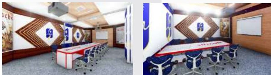
Gambar 5.12 : Ruang Rapat Sesudah