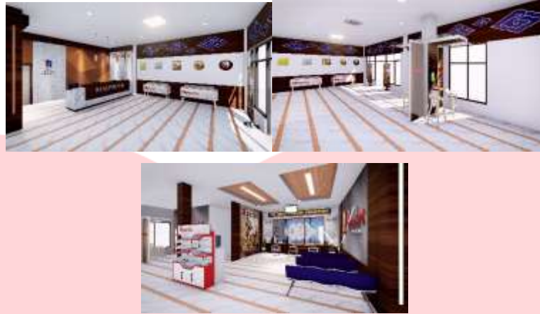
Gambar 5.3 : Ruang Lobi Sesudah