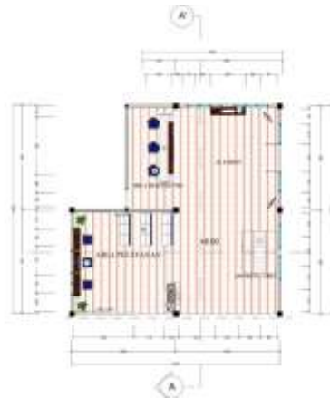
Gambar 5.1 Layout Denah Khusus Lobby