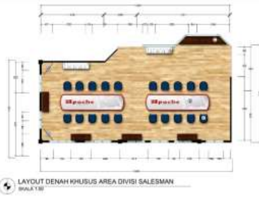
Gambar 5.4 : Layour Denah Khusus Ruang Salesman

Konsep yang diaplikasikan pada ruang salesaman adalah yang ada pada kantor Apache Cirebon menggunakan sistem open plan, dimana sebisa mungkin untuk memberikan keterbukaan antar pengguna agar memberikan suasana bagi pegawai untuk bebas dalam diskusi, ataupun bersosialisasi sehingga akan meningkatkan efektifitas dalam bekerja. Aktivitas yang dimiliki oleh salesman adalah brainstorming dan rapat kecil dan melakukan pengiriman keluar. Material lantai yang digunakan adalah parket berwarna cerah. Material furniture yang digunakan adalah hpl, dan custom print poster kedalam furniture agar dapat menunjukkan bahwa divisi salesman berhubungan dengan brand. Penggunaan material parket custom pada area tunggu lobby dimaksudkan untuk pemberian estetika kepada ruangan dengan memberikan custom kepada lantai keramik. paket dipilih juga untuk kehinisan ruangan yang mana divisi salesman aktivitas yang keluar masuk ruangan sehingga lebih baik untuk menggunakan parket yang mudah dibersihkan.