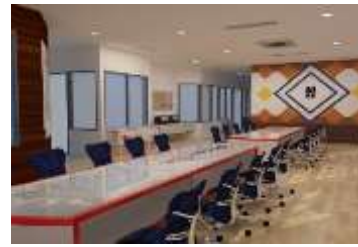
Gambar 5.6 : Ruang Salesman Sesudah