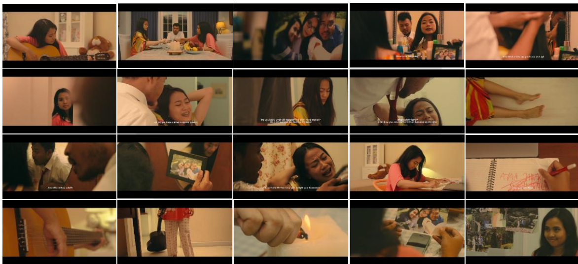
Gambar 3. Media Utama Film Pendek Nada

Pelaksanaan proses pascaproduksi film pendek ini berlangsung mulai dari bulan April sampai dengan bulan Juli. Hal ini dilakukan demi mendapatkan hasil yang maksimal, mulai dari warna hingga suara yang akan ditampilkan dalam film pendek ini. Dalam proses editing , penulis membagi menjadi dua tahap yaitu offline editing dan online editing . Pada kedua tahap tersebut, penulis bekerja sama dengan editor dan music director untuk mencapai hasil yang maksimal dari segi warna, color grading , teks judul, subtitle , ambience , hingga credit title agar film ini dapat dengan siap dinikmati oleh khalayak sasaran.