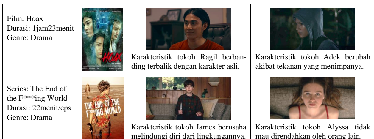
Tabel 1. Data dan Analisis Karya Sejenis