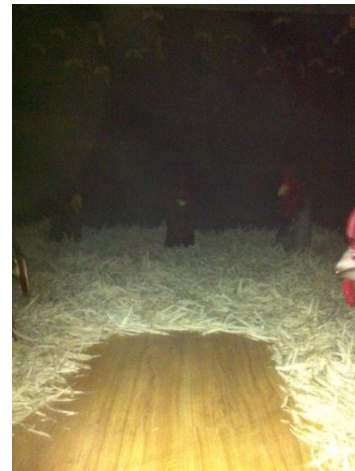
Gambar 5.2 instalasi karya alektorofobia