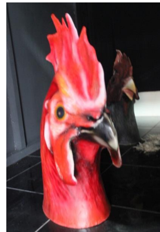
Gambar 5.5 patung ayam 3