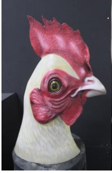
Gambar 5.6 patung ayam 4