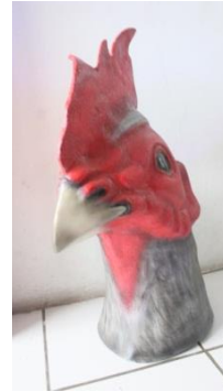
Gambar 5.8 patung ayam 6