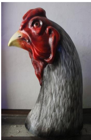
Gambar 5.3 patung ayam 1