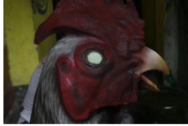
Gambar 5.7 patung ayam 5