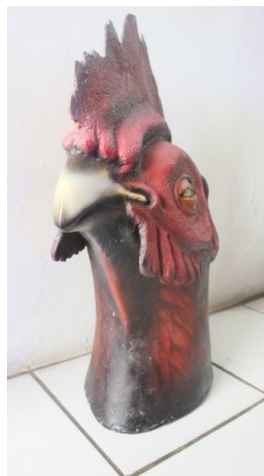
Gambar 5.4 patung ayam 2