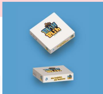
Gambar 3.5 Packaging Card Game Pilah-Pilih