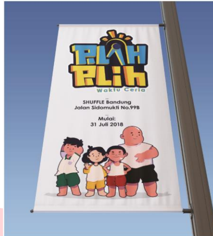
Gambar 3.10 Banner