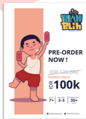
Gambar 3.8 Poster promosi