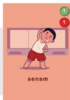
Gambar 3.3 Tampak Depan Kartu Aktivitas