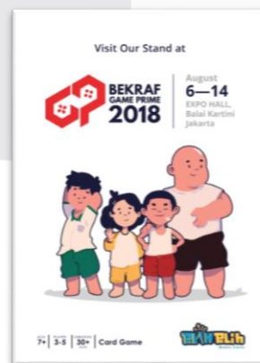
Gambar 3.9 Poster Event