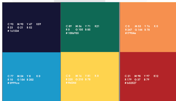
Gambar 3.1 Skema Warna

Warna yang digunakan pada seluruh visual kartu “Pilih-Pilih” mengacu pada keyword pada konsep pesan yaitu: playfull dan fun. Oleh karena itu, warna dominan yang akan digunakan adalah Putih, Biru, Merah, Hijau, Orange dan Kuning. Wana-warna tersebut juga dapat memberikan kesan yang menyenangkan dan bebas.