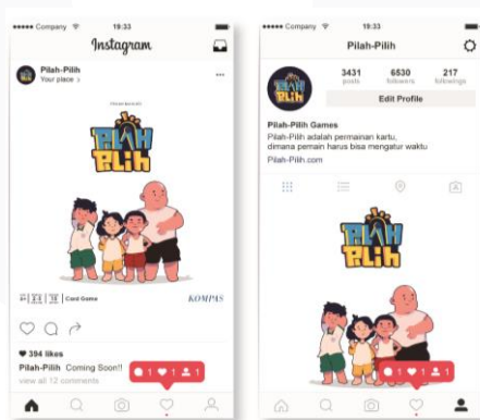
Gambar 3.6 Social Media Instagram