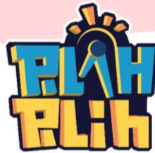
Gambar 3.2 Logo Cardgame