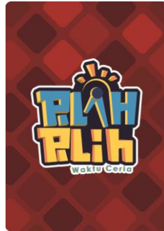
Gambar 3.4 Tampak Belakang Kartu Aktivitas