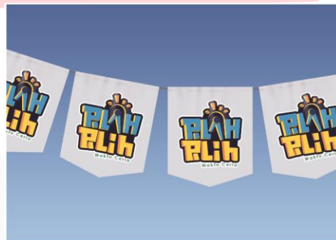
Gambar 3.11 Flag Chain