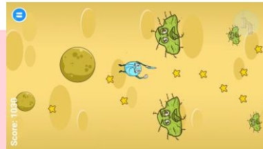
Gambar 3.3 Screenshot Level Karang