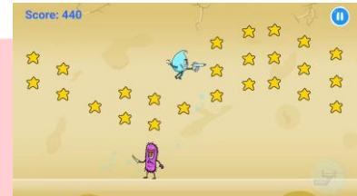
Gambar 3.4 Screenshot Level