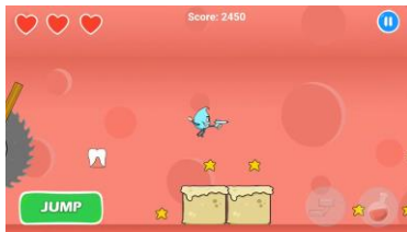
Gambar 3.2 Screenshot Level Plak Karies

Rewards didalam game ini dapat berupa item in-game yang dapat pemain gunakan pada gameplay . Terdapat juga rewards yang ada diluar gameplay yang utama yaitu rewards yang berisikan kumpulan-kumpulan video tentang cara-cara dan teknik dalam menyikat gigi dengan benar menurut para ahli. Sehingga pemain juga mendapatkan sisi pengetahuan tidak hanya tentang permasalahannya tetapi juga tentang cara membersihkannya atau mencegahnya.