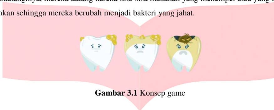
Gambar 3.1 Konsep game

Game yang berjudul “ Save The Tooth! ” ini merupakan sebuah game yang menceritakan tentang kehidupan zat pelindung gigi yang kehidupan zat tersebut diserang oleh bakteri Streptococcus Mutants yang menghancurkan lapisan terluar gigi hingga ke sel saraf yang nantinya dapat mengakibatkan terjadinya karies gigi. Bakteri jahat tersebut menjajah setiap gigi yang didatanginya, mereka datang karena sisa-sisa makanan yang menempel atau yang disebut dengan plak gigi tidak dibersihkan sehingga mereka berubah menjadi bakteri yang jahat.