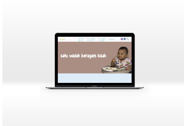
Gambar 4: Website

Website dalam kampanye ini berfungsi sebagai wadah informasi mengenai metode BLW ( Baby Led Weaning ) lebih lengkap, tips dan trick, forum diskusi mengenai Parenting, artikel-artikel mengenai parenting serta resep-resep makanan yang mudah untuk diterapkan bagi Keluarga