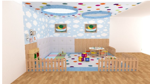
Gambar 3: Ambient Media/Booth

Pada kampanye ini, penulis membuat Ambient Media yang berupa Booth dan berisi mini playground serta mini station yang ditempatnya terdapat meja-meja kecil beserta makanan yang dapat dicoba oleh sang ibu dan anak, para Ibu dan Anak ini bisa mencoba Metode BLW ( Baby Led Weaning ) secara langsung