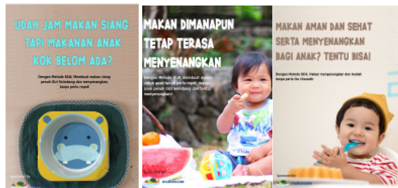
Gambar 1: Poster

Sosial Media viral ini menjadi salah satu pemancing utama agar para khalayak sasaran mengetahui adanya kampanye ini, serta menjadi buah bibir dari para Khalayak Sasaran.