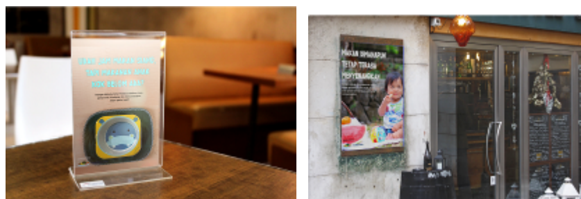
Gambar 2: Pengaplikasian Poster pada Luar Ruang

Dalam Poster ini, tidak ada perbedaan dengan Sosial Media Viral Post. Yang menjadi pembeda adalah versi ukuran serta media penayangan poster ini. Poster ini akan diletakkan di tempat-tempat makan/cafe yang Family-Friendly di Mall. Poster bisa diletakkan di Meja Makan, ataupun di dinding-dinding para Café/tempat makannya.