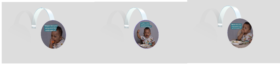
Gambar 5: Wobler