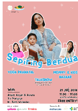
Gambar 6: Poster Event

Flyer ini akan memuat Poster Event dari kampanye ini. Poster event ini dirancang menggabungkan unsur fotografi serta ilustrasi agar menarik minat Khalayak Sasaran.