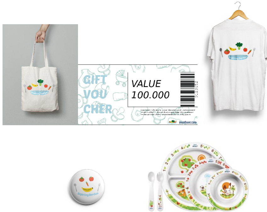
Gambar 8: Merchandise

Merchandise akan diberikan setelah event berlangsung, yang berfungsi sebagai pengingat terhadap kampanye serta event ini. Merchandise yang didapatkan ada baju, pin, totebag, serta perlengkapan makan anak.