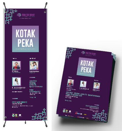
Gambar 5. Media informasi dan pendukung