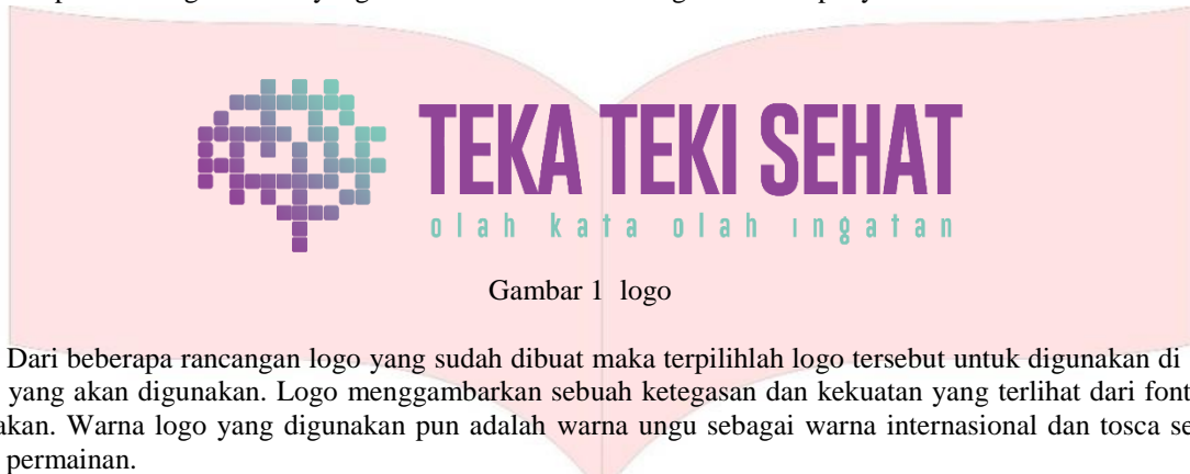
Gambar 1 logo

Adapun rancangan media yang telah dibuat dan dirancang untuk kampanye ini.