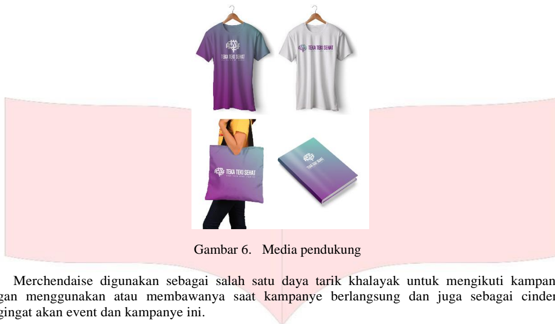
Gambar 6. Media pendukung

Merchandise digunakan sebagai salah satu daya tarik khalayak untuk mengikuti kampanye ini dengan menggunakan atau membawanya saat kampanye berlangsung dan juga sebagai cinderamata pengingat akan event dan kampanye ini.