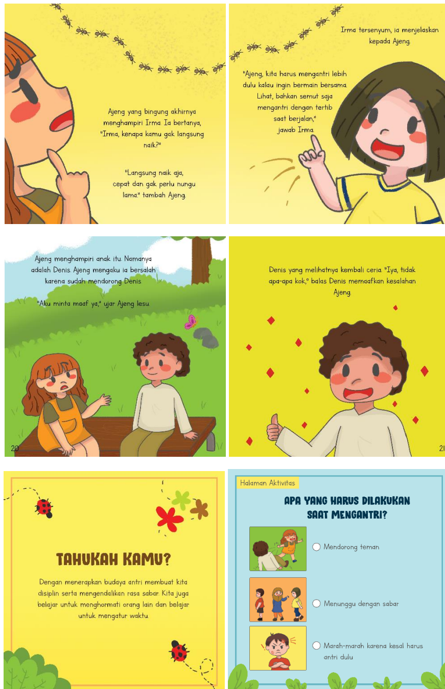
Gambar 1.2 Halaman Isi