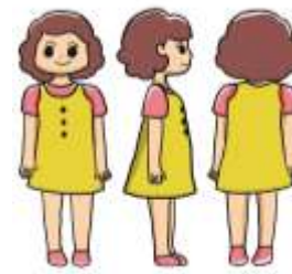
Gambar 4 Karakter Bitu

Bitu adalah anak perempuan berusia lima tahun. Karakternya memiliki sifat yang ingin serbatahu, mandiri, dan pintar. Namun Ia sering menghabiskan waktunya di dalam rumah.