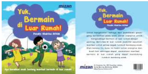
Gambar 8 Cover Buku

Desain cover buku ilustrasi yang dibuat menggunakan warna warna cerah agar anak-anak tertarik untuk melihat buku. Selain itu tipografi yang digunakan menggunakan jenis handwritten , agar terlihat menarik untuk judul buku. Ilustrasi yang digunakan menggunakan latar tempat di luar rumah sesuai dengan topik bermain di luar rumah.