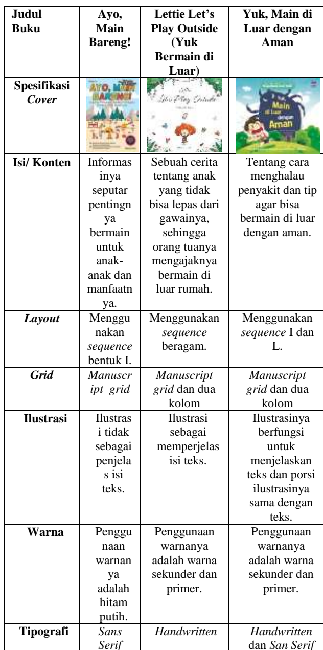
Tabel 1 Analisis Data Proyek Sejenis

Adapun hasil analisis data proyek sejenis di atas sebagai berikut: