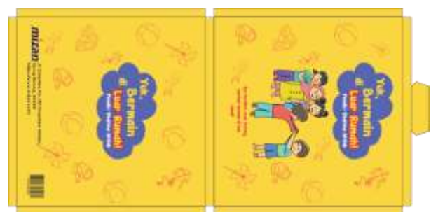
Gambar 12 Kemasan Buku