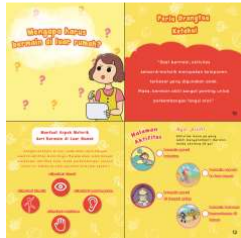
Gambar 10 Interaktif pada Buku

Setiap akhir sub bab cerita terdapat sejumlah interaktif yaitu terdapat sebuah quote , fakta, dan interaktif game yang menyesuaikan tema di setiap sub bab cerita.