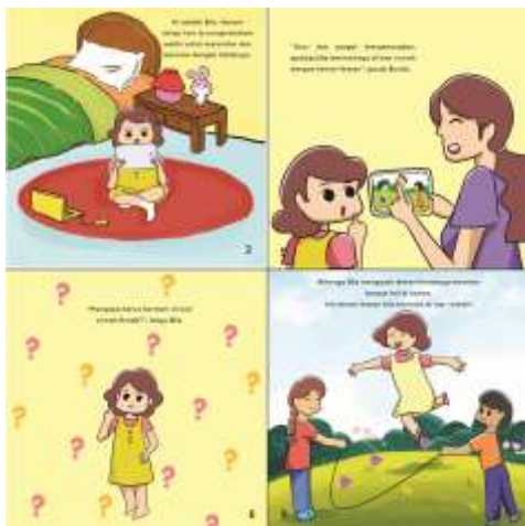
Gambar 9 Isi Buku

Berikut adalah salah satu sub cerita yang dibuat. Seluruh cerita yang dibuat menyesuaikan aspek tumbuh kembang anak.