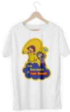
Gambar 13 T-Shirt