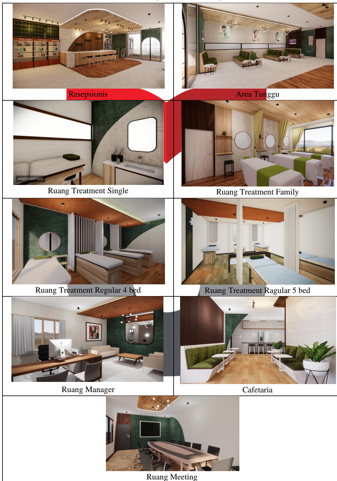
Tabel 2. (Visualisasi Desain)

Pengaplikasian desain interior Naavagreen Natural Skincare berdasarkan pendekatan aktivitas dan perilaku serta tema dan konsep yang dipilih :