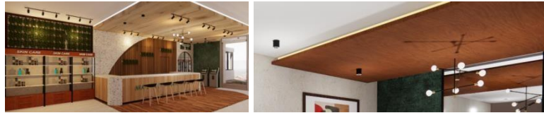
Gambar 2. (Pencahayaannya)