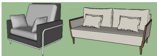
Gambar 3 (Sofa pada ruang tunggu)

Untuk mendukung konsep arsitektur femnisme pada area tunggu. akan dihadirkan