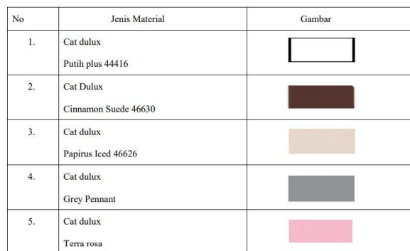
Tabel 1 (Konsep Material)

Konsep material dinding sebagian besar menggunakan kaca hal ini agar membuat kantor BP3A mendapatkan pencahayaan dan penghawaan alami yang cukup. Dinding dalam bangunan ini menggunakan batu bata dan beberapa partisi menggunakan multiplex.