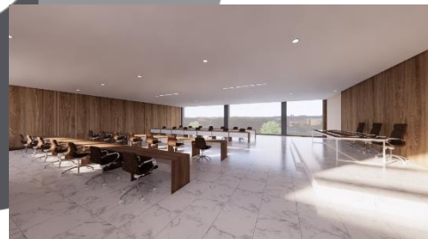
Gambar 8 (Desain Ruang Aula publik)

Ruang aula pada kantor Badan Pemberdayaan Perempuan dan Perlindungan anak terbagi atas dua area yaitu Ruang Aula Publik dan juga Ruang Aula Private. Dimana perbedaan dari kedua ruang tersebut yaitu area private hanya digunakan oleh pegawai staff kantor BP3A ini dimana untuk kegiatan yang berhubungan dengan rencana kerja pada tahun berikutnya. Sedangkan untuk Ruang aula publik yaitu untuk digunakan pada acara-acara besar dengan kapasitas kurang lebih dapat menampung 50 orang didalamnya.