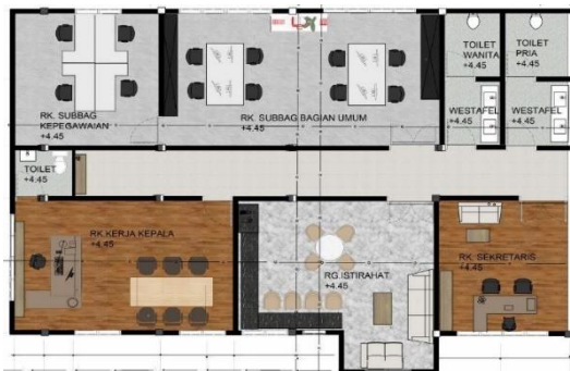
Gambar 2 (peletakan furniture Lantai 2)