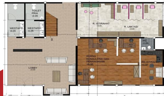
Gambar 4 (peletakan furniture main lobby)

Beberapa aksesoris ruangnya dari segi warna dan juga pemilihan furniture. Furniture yang digunakan akan menyesuaikan dengan kegiatan dan fungsi dari masing-masing ruang pada Kantor BP3A.