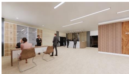
Gambar 6 (Desain Area Lobby)

Pada area lobby, perancangan ulang ini mendesain ulang peletakan furniture area receptionist dengan area pendaftaran pada satu area dikarenakan dua kegiatan ini saling berhubungan antara satu dengan lainnya yang dimana akan memberikan kesan nyaman dan juga