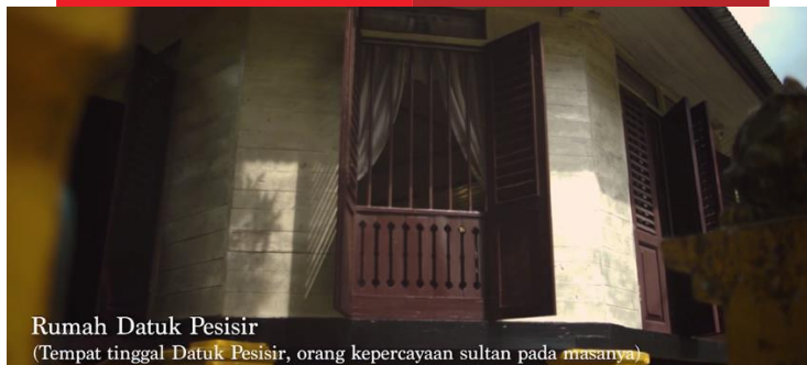
Gambar 9. Rumah Datuk Pesisir