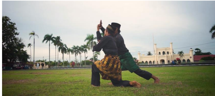
Gambar 8. Cuplikan Silat