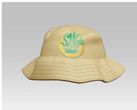
Gambar 17. Bucket Hat Siak Ni Wak