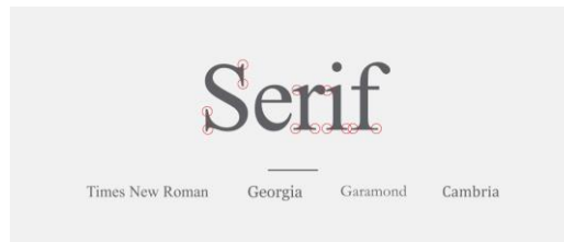
Gambar 1. Font