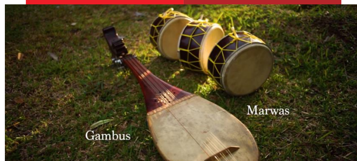
Gambar 6. Cuplikan Alat Musik