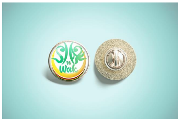
Gambar 15. Enamel pin Siak Ni Wak