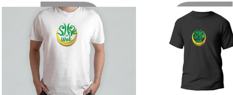
Gambar 14. Baju Siak Ni Wak

Membuat baju sebagai media pendukung dari media utama. Desain yang digunakan pada media baju ini berupa logo dari Siak Ni Wak seperti logo pada video, dengan ukuran baju yang dibuat mulai dari ukuran S, M, L, XL, XXL. Sedangkan bahan yang digunakan adalah bahan combad 24s