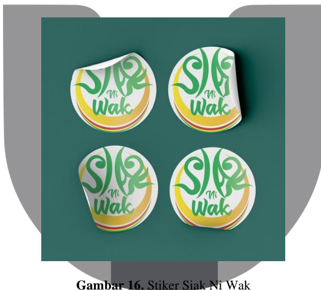
Gambar 16. Stiker Siak Ni Wak

Pembuatan stiker menggunakan bahan laminasi doff, bertujuan untuk mengingatkan orang-orang tentang video Siak Ni Wak .