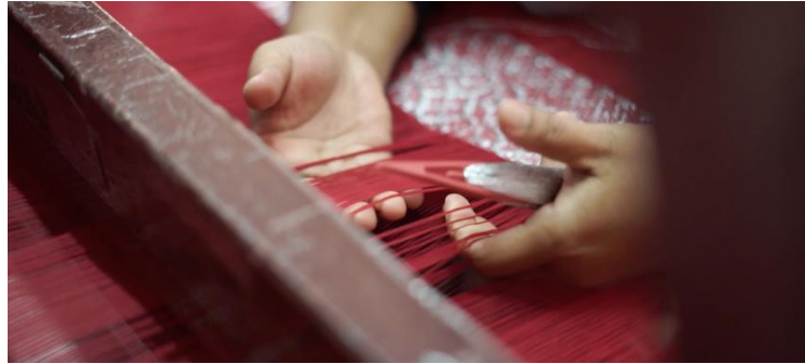
Gambar 11. Cuplikan Menenun