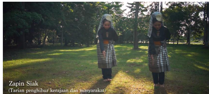
Gambar 5. Cuplikan Zapin