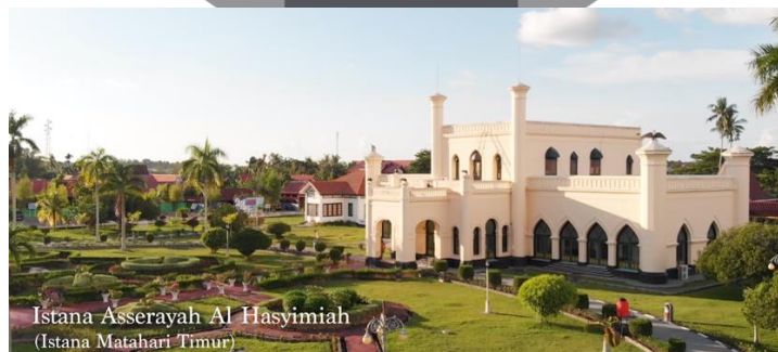
Gambar 4. Cuplikan istana