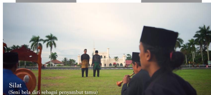
Gambar 7. Cuplikan Silat