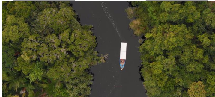
Gambar 3. Cuplikan Pembukaan