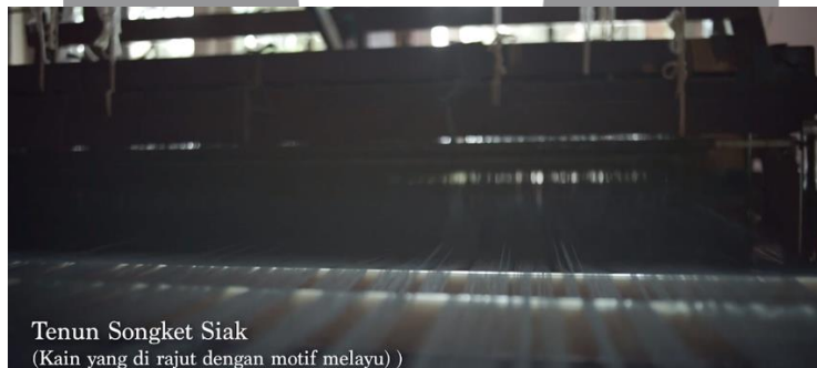
Gambar 10. Cuplikan Mesin Tenun