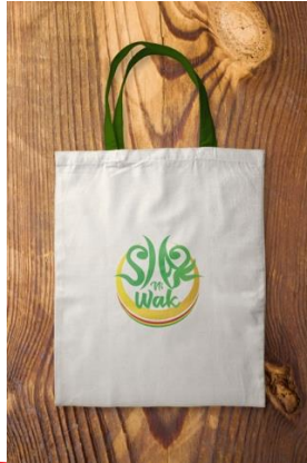
Gambar 13. Totebag Siak Ni Wak