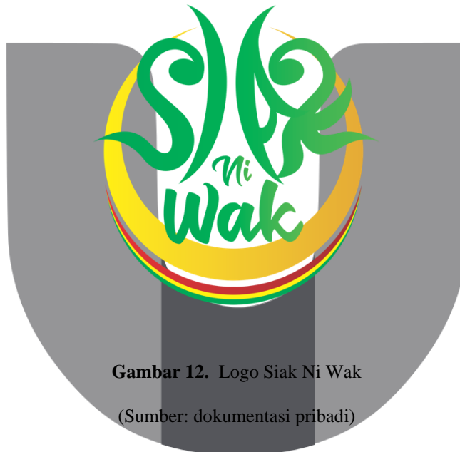
Gambar 12. Logo Siak Ni Wak

Logo ini dibuat untuk membantu dalam penerapan video dan media pendukung lainnya agar dapat memiliki identitas tersendiri. Logo ini terinspirasi dari lambang kerajaan di kota Siak Sri Indrapura.