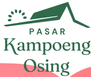
Gambar 6.1 Hasil Perancangan Logo