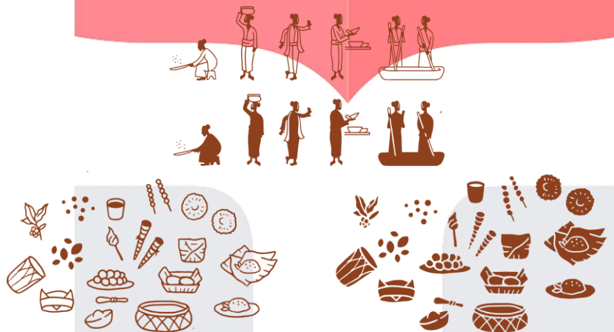
Gambar 6.2 Ilustrasi