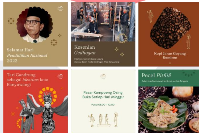
Gambar 4. 2 Poster