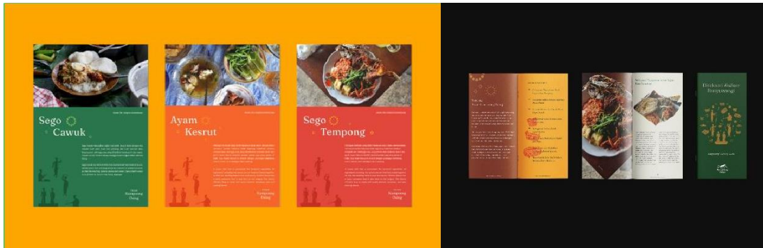
Gambar 4. 1 Poster