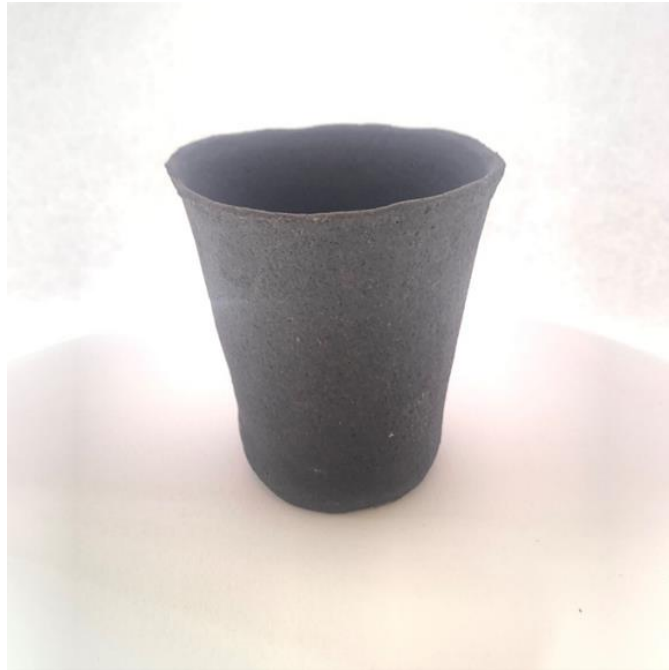
Gambar 3 Hasil akhir