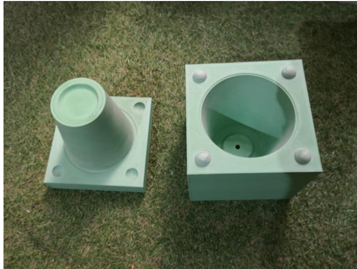
Gambar 2 Cetakan cangkir

dilakukan agar mempermudah dalam input data dan juga pencetakan 3D printer. Proses pembuatan cetakan dilakukan di vendor 3D printer.