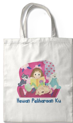
Gambar 2.9 Totebag