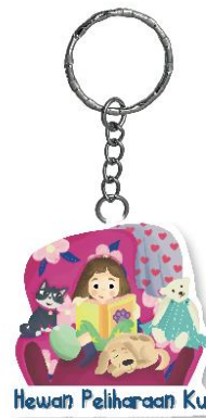
Gambar 2.10 Gantungan Kunci