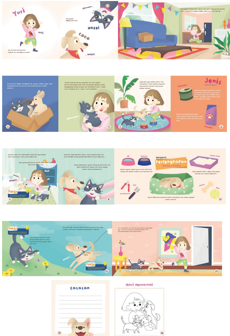
Gambar 6 Isi Buku