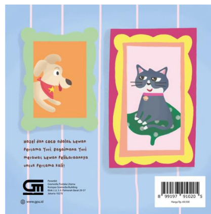
Gambar 5 Cover buku Hewan Peliharaan Ku