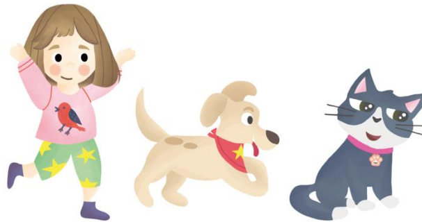
Gambar 4 karakter ilustrasi