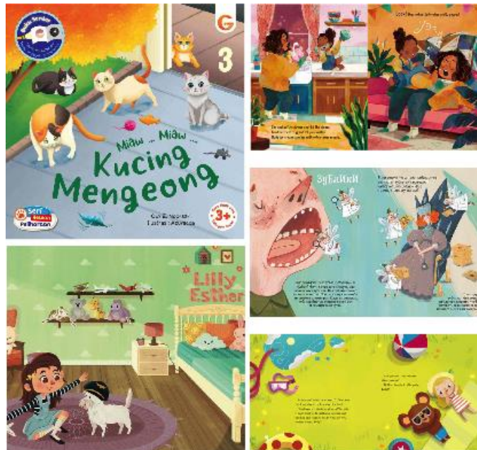
Gambar 1 Referensi Visual

referensi visual yang digunakan dalam perancangan buku ilustrasi Hewan Peliharaan Ku: