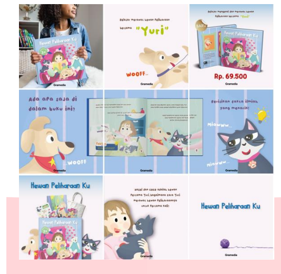
Gambar 11 Feeds Instagram Sumber: Nabila Shabrina, 2022