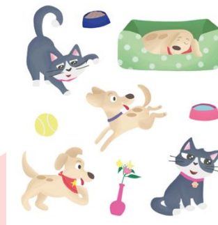
Gambar 2.8 Stiker