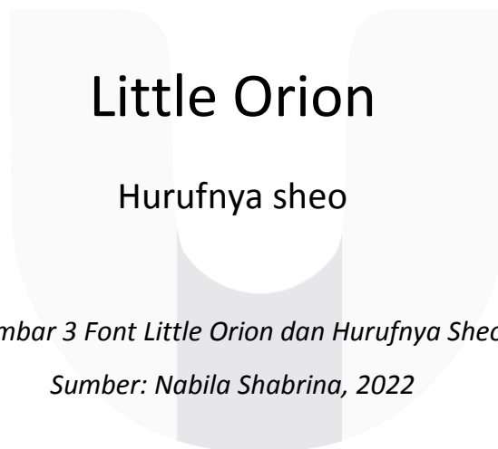
Gambar 3 Font Little Orion dan Hurufnya Sheo

Tipografi dalam perancangan buku ilustrasi ini menggunakan jenis tipografi sans serif yang akan memberikan tampilan sederhana sehingga mudah dibaca oleh orang tua sebagai pendamping baca dengan anak. Font Little Orion sebagai Headline pada cover dan Hurufnya sheo sebagai isi buku.