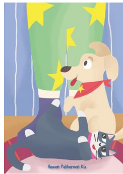
Gambar 2.7 Poster