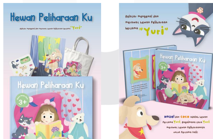
Gambar 12 Poster Utama