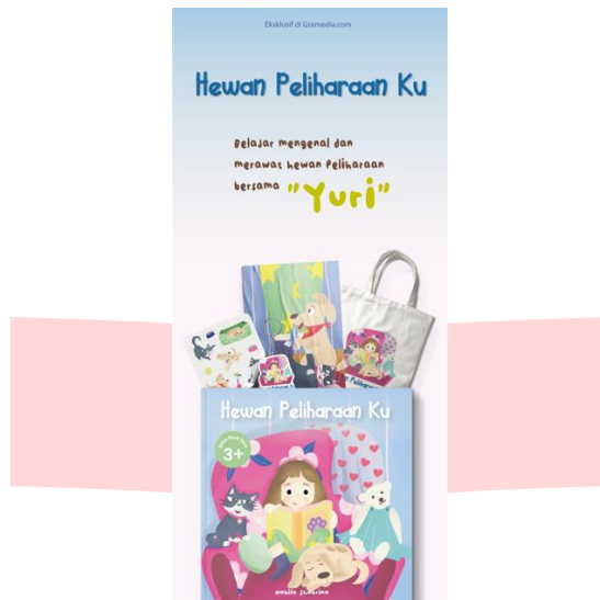
Gambar 13 Poster Instagram Ads