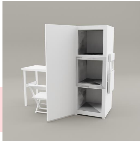
Gambar 4 Sketsa Alternatif 2

Sketsa alternative yang kedua peneliti mendesain pada pintu lemari tersebut, desain pada lemari tersebut menggunakan satu pintu, dan terdapat tiga laci yang terdapat pada lemari tersebut.