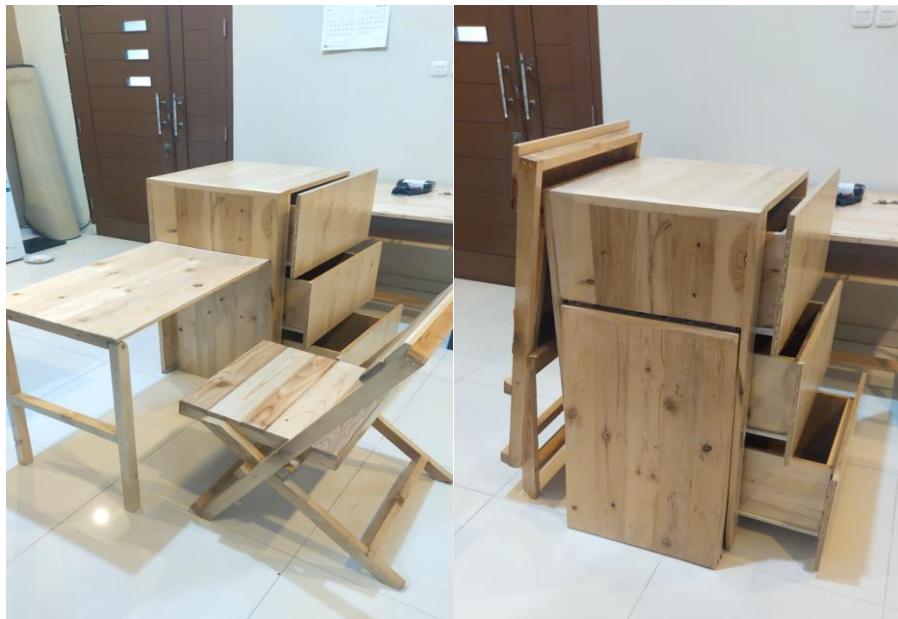
Gambar 7 Prototyping