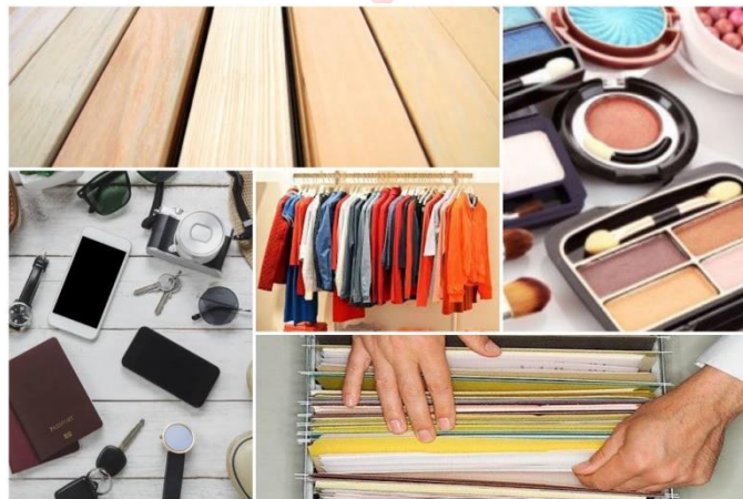
Gambar 2 Image Board

Image Board adalah kumpulan atau kompilasi gambar atau objek lain yang bertujuan untuk menjelaskan cara penggunaan pada lemari, dan bertujuan untuk mengetahui untuk menyimpan apa saja pada lemari tersebut.