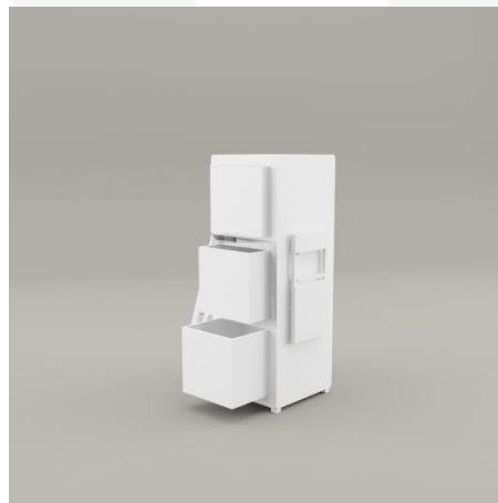
Gambar 3 Sketsa Alternatif 1

Pada sketsa alternatif satu peneliti membuat lemari multifungsi dengan tambahan meja dan kursi yang terdapat pada lemari tersebut, sketsa pertama ini peneliti mendesain lemari tersebut dengan tiga laci yang terdapat pada depan lemari.