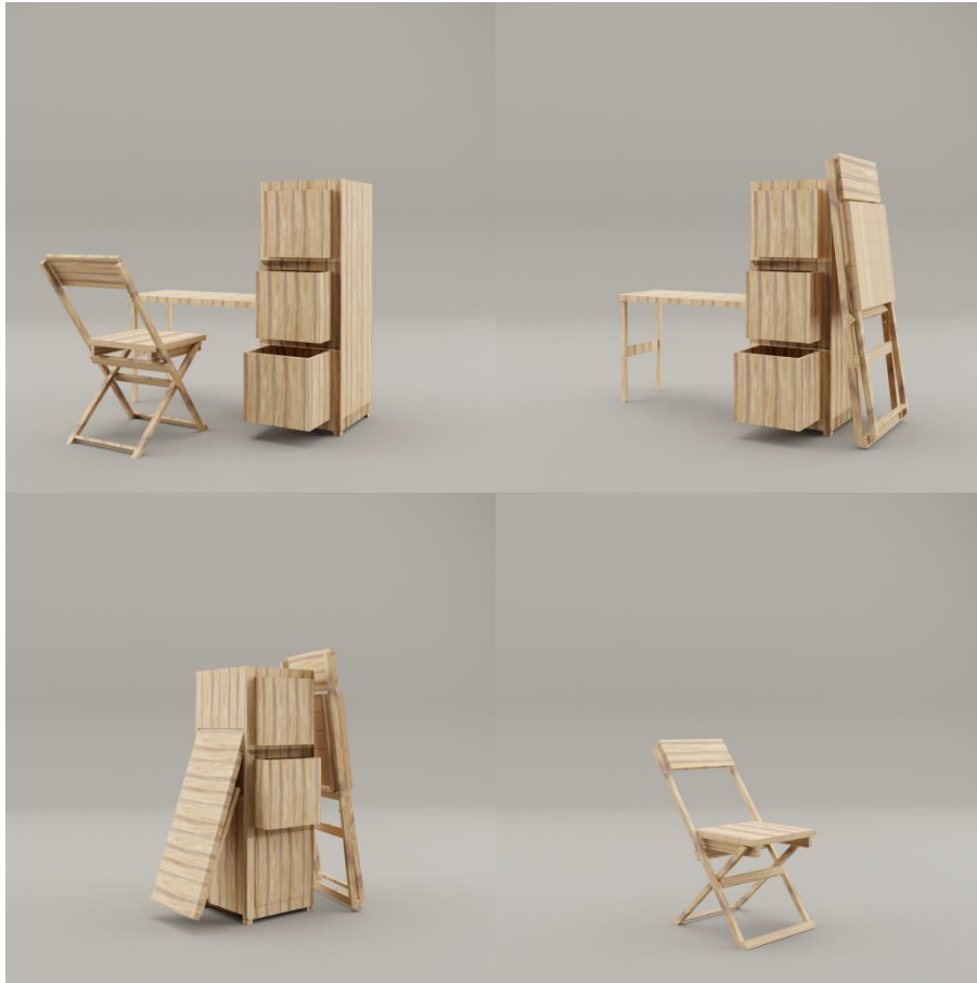
Gambar 6 Desain Final