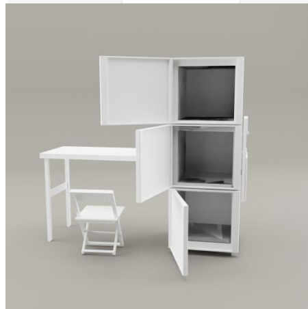
Gambar 5 Sketsa Alternatif 3

Sketsa alternatif yang ketiga peneliti mendesain lemari yang sama dengan sketsa alternatif satu dan dua, akan tetapi pada pintu yang terdapat pada sketsa alternatif ketiga ini menggunakan tiga pintu untuk laci tersebut.