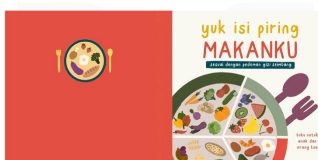
Gambar 3.2 Cover depan & belakang