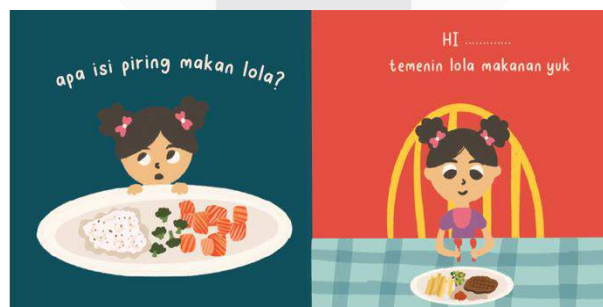
Gambar 3.3 Pendahuluan