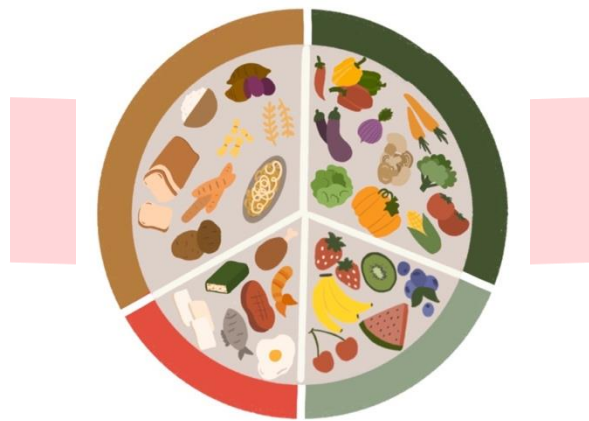
Gambar 3.8 Stiker tempat makan

Selain digunakan untuk merchandise , tempat makan juga digunakan sebagai salah satu cara untuk menerapkan program “Isi Piringku” yang sesuai dengan anjuran pemerintah, serta mengajak anak untuk membawa bekal sendiri, dan orang tua dapat menyiapkan bekal anak yang sesuai dengan takarannya.