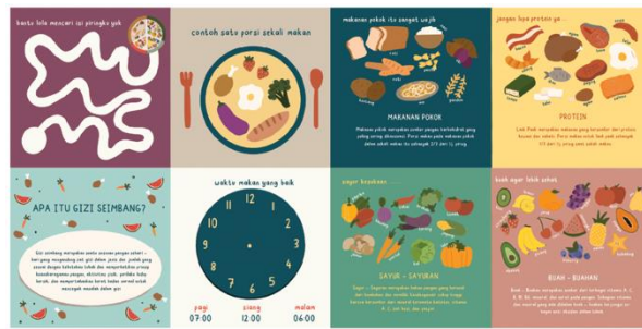
Gambar 3.4 Isi buku