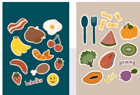
Gambar 3.7 Sticker

Selain digunakan untuk merchandise , stiker juga dapat dijadikan sebagai media pendukung, karena dengan menggunakan stiker akan melatih motorik pada anak, dan didalam stiker tersebut berisikan informasi tentang gizi seimbang yang bisa ditempel pada botol minum mereka, buku, atau benda lainnya.