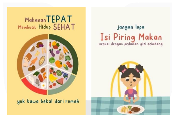
Gambar 3.6 Poster

Poster digunakan sebagai salah media promosi yang akan disebarakan ke tempat umum untuk menarik target audience agar mengetahui produk yang dibuat