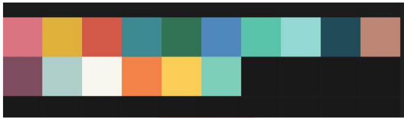
Gambar 4.4 Referensi warna

Berikut adalah warna yang digunakan sebagai acuan pada perancangan buku ilustrasi untuk memperkuat tema ilustrasi dari buku yang sudah ditentukan. Warna yang dipilih menyesuaikan teori yaitu warna kontras akan yang dapat digunakan sebagai alat komunikasi dengan anak dan akan menarik perhatian anak untuk membaca dan tidak melakukan aktifitas lain, warna ini pun dapat digunakan untuk mengekspresikan berbagai emosi anak.