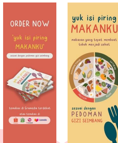
Gambar 3.5 Banner