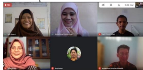
Gambar 3. Pertemuan Google Meet dengan Mitra

Kegiatan pengabdian masyarakat dilakukan dengan pemberian wawasan mengenai alat ukur suhu tubuh berbasis sensor infrared kepada pihak guru dan kepala sekolah SMP IT Ulul Azmi melalui media google meet. Tim dosen mengimplementasikan alat ukur suhu tubuh dilingkungan SMP IT Ulul Azmi agar kegiatan akademik tetap bisa berjalan dengan baik serta sesuai protokol kesehatan. Alat ukur suhu tubuh berbasis sensor infrared diperlihatkan pada Gambar 2.