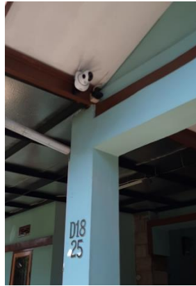
Gambar 10 Perangkat kamera IP yang sudah terpasang

Hasil pengamatan yang dilakukan selama 3 bulan diperoleh data bahwa untuk microSD yang digunakan sebesar 128GB dapat menyimpan hasil rekaman selama 15 hari penuh untuk durasi waktu 24 jam dan jika datanya penuh maka akan dilakukan overwrite untuk data selanjutnya.