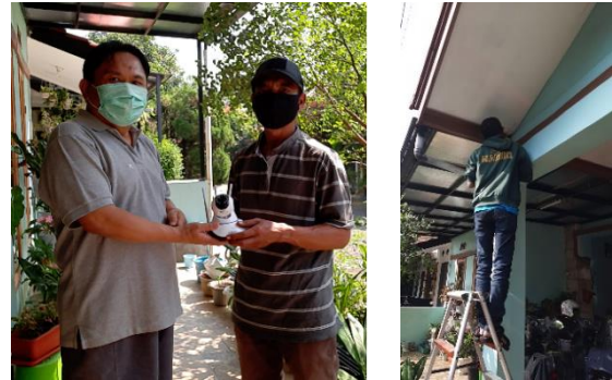
Gambar 9 Serah terima dan pemasangan perangkat

Kemudian dilakukan pemasangan pada salah satu rumah warga yang menjadi titik akses masuk ke wilayah RT 04 RW 13 sebagai titik akses yang mudah dilakukan pengawasan dan monitoring seperti Gambar 9.