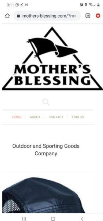
Gambar 2. Tampilan website versi mobile dari UMKM Mother's Blessing

Untuk melakukan evaluasi terkait hasil implementasi dan pelaksanaan pengabdian masyarakat di UMKM Mother's Blessing, tim melakukan survei kepada mitra. Hasil survei menyatakan bahwa tujuan dari pengabdian masyarakat sesuai dengan kebutuhan mitra sasar dan tim membantu mitra dalam menggunakan teknologi dengan sangat baik. Selain itu, mitra juga berharap ada program lanjutan untuk pengabdian masyarakat