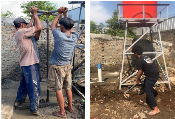
Gambar 1 Rancang bangun sistem penyediaan air bersih di Desa Citeureup