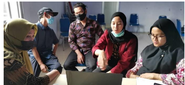
Pengujian Sistem Informasi oleh Perangkat Desa