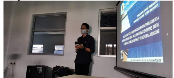
Pembukaan Kegiatan Pengabdian kepada Masyarakat