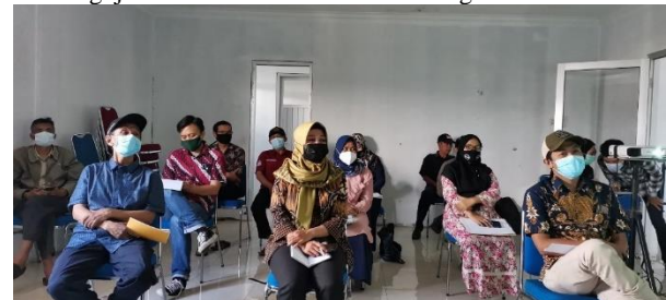
Peserta Berasal dari Perangkat Desa dan Perwakilan Ketua RW