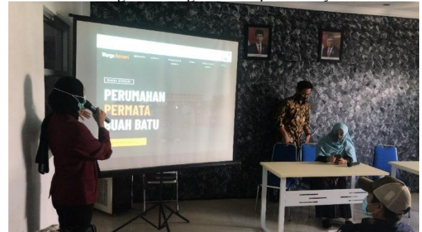
Presentasi Sistem Informasi