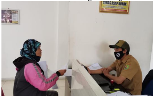
Gambar 3 Kondisi Pelayanan Masyarakat