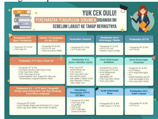
Gambar 5 Poster dipasang di Rumah Ketua RT

Dengan kondisi ini perlu dibuat sebuah aplikasi layanan administrasi surat kependudukan berbasis online agar staf pelayanan di Desa Lingsong dapat dengan mudah melayani administrasi pembuatan surat kependudukan. Selain itu masyarakat tidak perlu mendatangi kantor kelurahan, cukup mengajukan permohonan pembuatan surat dari rumah melalui aplikasi web. Sehingga tujuan utama desa Lingsong sebagai Smart Village bisa tercapai (Maja, Meyer, & Von Solms, 2020). Untuk meningkatkan public awareness masyarakat Desa Lingsong diperlukan berbagai media sosialisasi, salah satunya dalam bentuk infografis seperti contoh di bawah ini: